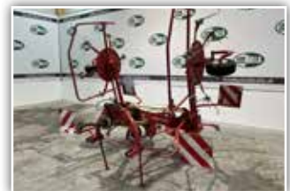
LEILY Kreiselheuer Stabilo 5 , 5 Meter Arbeitsbreite, hydraulisch klappbar, Zettwinkelverstellung, Wickerschutz, Grenzstreuervorrichtung, Gelenkwelle, 3.250.- inkl. Verm.