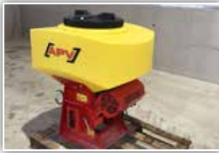
APV PS 200 M1 , pneumatisches Sägerät, 200 Liter Inhalt, 5,2 Steuermodul - geschwindigkeitabhängig und hubwerkabhängig