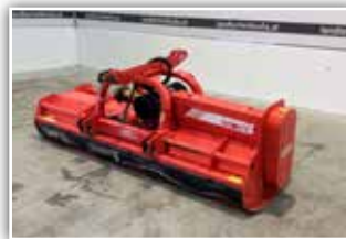
MASCHIO Bisonte 280 , Bj. 2020, Front- und Heckmulcher, 1000 U/min Antriebsdrehzahl, Doppel Dreipunktanbaubock, Gegenschneiden, Stützwalze, hydr. Seitenvershub, Gelenkwelle, 6.750.- inkl. Verm.