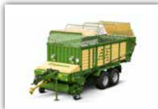
KRONE Ladewagen AX 280 L , Schneidwerk mit 32 Messer, Bereifung 620/40 R22.5