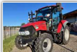
CASE IH Farmall 55 C , Neumaschine, Synchro Shuttle Getriebe, Bereifung 14.9 R20 vorne und 16.9 R30 hinten, 3x DW ZSTG, Luftsitz, Komfortbeifahrersitz