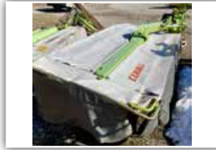
CLAAS Disco 3500 Heckmäherwerk , Bj. 2010, 5.800.- inkl. Verm.