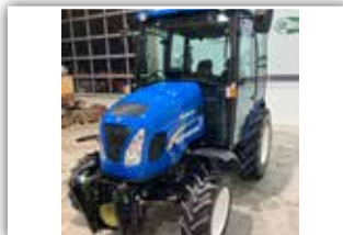
NEW HOLLAND Boomer 50 , Bj. 2019, 110 h, Dop-pelkabine mit zwei vollwertigen Sitzen, Heizung, Kli-maanlage, FH, FZW, Front- und Heckkamera, Traktor ist neuwertig, 46.800,- inkl. 20%