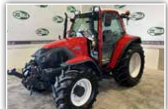
LINDNER Lintrac 75 LS , Bj. 2021, 360 h, Lastschalt-getriebe, 4x DW ZSTG, EHR, Zusatzhubzylinder, Klima-anlage, Kabinenfederung, Motordrehzahlspeicher, Traktor ist neuwertig, 68.900,- inkl. Verm.