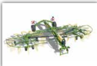
KRONE Swadro TC 880 , Hauptfahrwerk gelenkt, klappbare Zinkenarme, Tandemachse, Schwadttuch