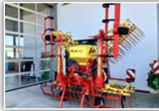
APV Nachsaatstriegel GS 600 M1 , Vorführer, Bj. 2022, 2 Striegelreihen mit 10 mm, 2 Striegelreihen mit 8mm, Einebnungsschiene, pneumatisches Sägerät PS 300 M1