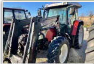
STEYR 9080 MT , Bj. 2008, 9.200 h, Hydrac Frontlader EK 2200 mit Kreuzhebel, Multikontroler, Fronthubwerk, 39.500,- inkl. Verm.