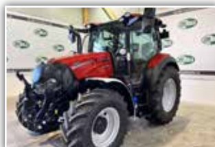
CASE IH Vestrum 120 AD8 , Neumaschine, FH, 24/24 Gang Getriebe mit 8-fach Lastschaltung, gef. Vorderachse, gef. Kabine, 600/65 R34 hinten, Panoramadach, 6x DW ZSTG, Druckluftanlage