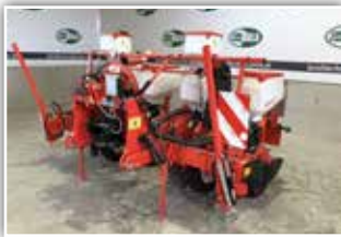
GASPARDO Maissämaschine MTR 4 Reihen , MTR Säaggregat mit Doppelscheibenschar, V Andruckrollen, Spuranreißer, Beleuchtung, Gelenkwelle, Optional Mikrogranulatstreuer