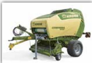
KRONE Vari Pack V 165 XC Plus , Schneidwerk mit 26 Messer, Druckluftbremse, Zentralschmieranlage, Bedienterminal DS 800, K80 Anhängervorrichtung, Arbeitsbeleuchtung