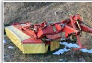
PÖTTINGER Nova Cut , 3.900.- inkl. Verm.