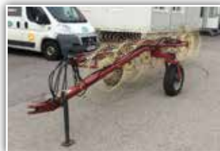
SITREX Sternradswader , Bj. 2015, 7 Sterne, vollhydraulisch, neuwertig, eine Saison im Einsatz, 4.850.- inkl. Verm.