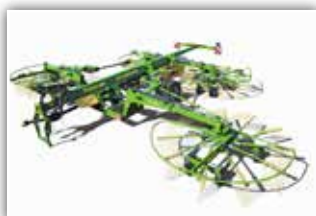
KRONE Swadro TC 1250 , Schwadttuch, elektrische Einkreiselaushebung, paarweise Kreiselaushebung, Arbeitsscheinwerfer