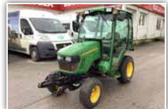
JOHN DEERE 2320 HAST , Bj. 2006, hydrostatischer Fahr-antrieb, Kabine, Allrad, Fronthubwerk, Heckhub-werk, Heckzapfwelle, Zwischenachsmähwerk mit Saugkorb