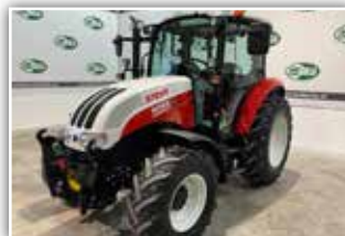
STEYR Kompakt 4085 , Bj. 2016, 2.900 h, Power Shut-tle Getriebe, Lastschaltung, FH, FZW, Klimaanlage, EHR, 2x DW ZSTG mit Kreuzhebel, hydr. Anhängerbremse, Multicontroller, 57.500,- inkl. Verm.