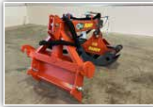
AUER Holzzege 1700 EFH , Euro Aufnahme für Frontlader, 3 Punkt Anbau, mechanisch teleskopierbar, Zangenöffnungsweite 170 cm