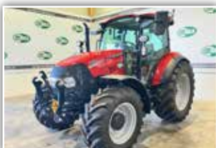
CASE IH Farmall 100 C HD , Neumaschine, Power Shuttle, Lastschaltung, 40 km/h Eco Getriebe, breite Vorder- und Hinterachse in stärkerer Ausführung, FH, FZW, Klimaanlage, Bereifung 440/65 R24 vorne und 540/65 R34 hinten