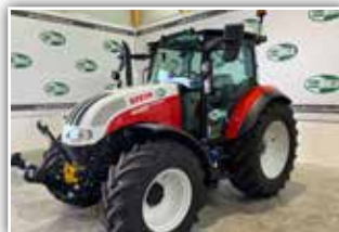
STEYR Kompakt 4090 , Bj. 2023, Neumaschine, Power Shuttle, Lastschaltung, 40 km/h ECO, FH, FZW, EFH, Klimaanlage, Multicontroller, DLA, 440/65 R24 und 540/65 R34, 5x DW ZSTG mit Kreuzhebel, Luftsitz