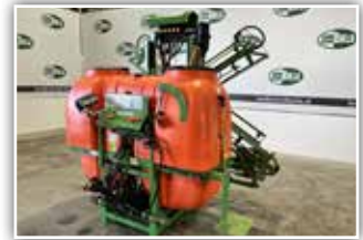
CLAAS Disco 3450 Heckmäherwerk , Gelenkwelle, 3.900.- inkl. Verm.