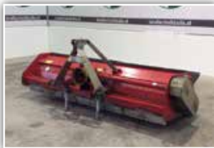
PALLADINO Hacksler TSM 285 , Bj. 2001, Heckmulcher, Stützwalze, Y-Messer, guter Zustand, 3.400.- inkl. Verm.