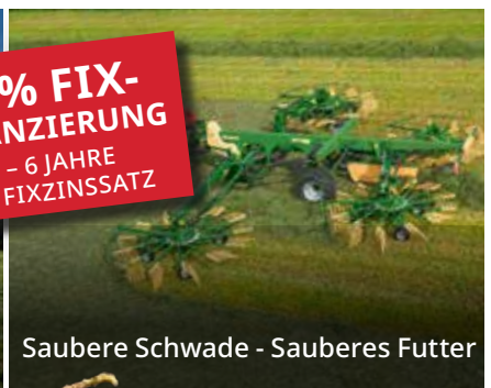
Saubere Schwade - Sauberes Futter

0,9 % FIX-FINANZIERUNG • AB 3 - 6 JAHRE • MIT FIXZINSSATZ