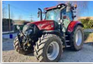
CASE IH Maxxum 150 CVX , Bj. 2023, 250 h, FH, Be-reifung 540/65 R28 vorne und 650/65 R38 hinten, AFS 700 Monitor, HMC 2 VGM, Accu Guide Lenksystemvor-rüstung, Maschine ist neuwertig, 127.500,- inkl. Verm.