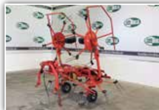
KUHN Kreiselheuer GF 5001 MH , Bj. 1999, 5 Meter Arbeitsbreite, hydraulisch klappbar, 4 Kreisler mit je 6 Zinkenarme, 3.950.- inkl. Verm.