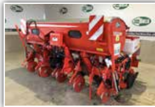
GASPARDO Maissämaschine MTR 5 Reihen ISOTRONIC , MTR Säaggregat mit Doppelscheibenschar, V Andruckrollen, elektrischer Säntrieb mit ISOBUS Elektronik, Düngertank 1200 Liter