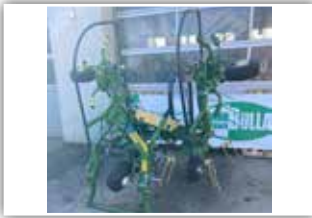
KRONE Vendro 420 High Land Kreiselheuer