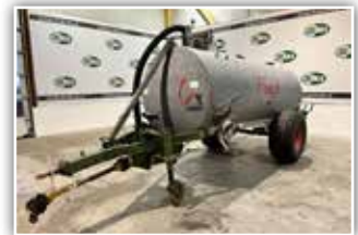
FLIEGL Güllefass Typ 70 , 7000 Liter Inhalt, Möscha Verteiler, Breitverteiler, Saugschlauch, hydr. Bremse, 2x Sauganschlüsse links, Weitwinkelgelenkwelle, 7.900.- inkl. Verm.