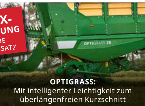
OPTIGRASS: Mit intelligenter Leichtigkeit zum überlängenfreien Kurzschnitt