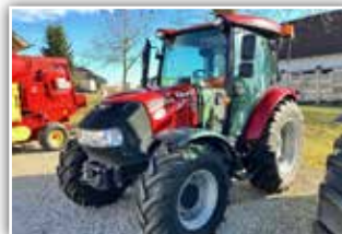
CASE IH Farmall 55 C , Bj. 2019, 550 h, Bereifung 14.9 R20 vorne, 16.9 R30 hinten, Traktor ist neuwertig, 31.800,- inkl. Verm.