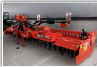
MASCHIO Falco 5000 Kreiselegge , hydr. klappbar, Zahnpackerwalze, Gelenkwelle mit Nockenschaltkupplung, gefederte Seitenschilder, Beleuchtung