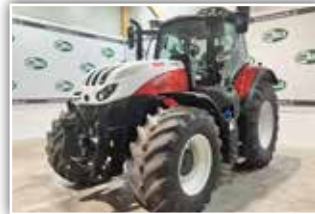
STEYR Absolut CVT 6200 S-Fleet , neues Modell, Bj. 2024, 250 h, Vorführer, FH, Bereifung 600/65 R28 und 710/70 R38 Trelleborg, S-Brake, hydr. Kabinenfederung