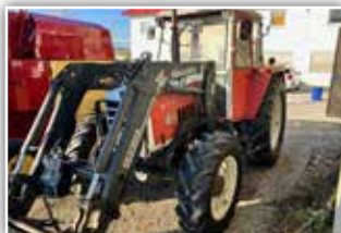
STEYR 8090 Allrad , Bj. 1985, Hydrac Frontlader, Be-reifung 16.9 R34, 19.800 inkl. Verm.