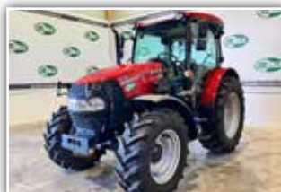
CASE IH Farmall 90 A , Neumaschine, neues Modell, Power Shuttle Getriebe, 3x DW ZSTG, Bereifung 380/70 R24 vorne und 480/70 R34 hinten, Lift O Matic Heckhubwerk, Luftsitz