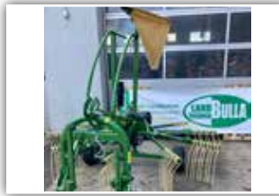
KRONE Swadro S 420 , Tastrad, hydr. Dämpfer, Beleuchtung