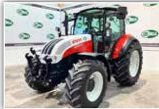
STEYR Kompakt 4105 HD , Bj. 2018, 1.850 h, 24/24 Gang 40 km/h ECO Getriebe, Power Shuttle Lastschaltung, FH, Druckluftanlage, Klimaanlage, Maschine mit breiten Achsen, Bereifung 540/65 R34, 62.500,- inkl. Verm.