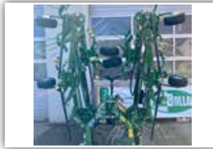
KRONE Vendro 820 High Land , Tastrad vorne schwenkbar, hydr. Grenzstreueinrichtung