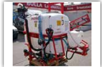
GASPARDO Sauro 800 Liter , 12 Meter Arbeitsbreite, Gestänge mechanisch oder hydraulisch klappbar, 5 Teilbreiten, Reinwassertank, Einspülschleuse, Handwassertank, Gestänge höhenverstellbar