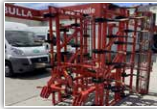
BRIX Unimax 450 H Leichtgrubber , Bj. 2024, Arbeitsbreite 4,5 Meter, hydraulisch klappbar, Flachstegwalze, Arbeitsbreiten auch in 3,4,5 und 6 Meter möglich