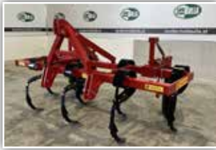
BRIX Golitah 300 Frontgrubber , Neumaschine, 7 Zinken, Stützräder mit AS Profil, Blattfederzinken mit Doppelherzchar