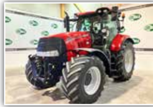
CASE IH Puma 200 CVX , Bj. 2018, 2950 h, FH, Be-reifung 600/65 R28 vorne und 650/75 R38 hinten, ABS Bremssystem, AFS 700 Monitor, Accu Guide Lenksystem Vorrüstung, HMC 2 VGM, ISOBUS, 129.500,- inkl. 20%