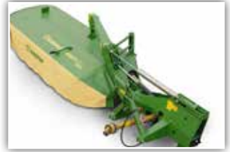
KRONE Easy Cut R 400 Heckmäherwerk