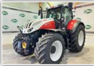
STEYR Terrus CVT 6300 , Bj. 2017, 2600 h, FH, FZW, 7x DW ZSTG, ABS Bremssystem, RTK Lenksystem, Bereifung IF 650/60 R34 vorne und IF 900/60 R42 Michelin Axioib, Leder-sitz mit Lüftung, 2x Stech 700 Monitor, 177.500,- inkl. Verm.