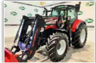
STEYR Multi 4120 , Bj. 2019, 370 h, 40 km/h ECO Getriebe, 4-fach Lastschaltung, gef. Vorderachse, gef. Kabine, Druckluftanlage, Klimaanlage, Hydrac Auto Lock Frontlader, Traktor ist neuwertig, 97.500,- inkl. Verm.