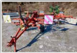
KUHN GA 6000 Doppelschwader , Bj. 2002, Beleuchtung, 5.800.- inkl. Verm.