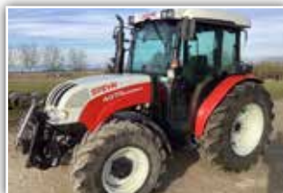
STEYR Kompakt 4075 , Bj. 2013, 3050 h, 32/26 Syn-cho Shuttle Getriebe, FH, FZW, Bereifung 380/70 R20 vorne und 480/70 R30 hinten, Druckluftanlage, Luftsitz, 44.800,- inkl. Verm.