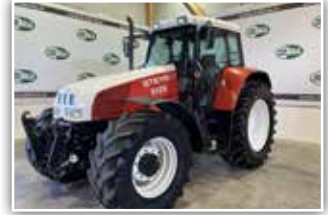
STEYR 9125 , Bj. 1996, 11.000 h, 24/24 Gang Getriebe, 6 Gänge und 4-fach Lastschaltung, EHR, 3x DW ZSTG, hydr. Oberlenker, 1 und 2 Leiter Druckluftanlage, Klima-anlage, Bereifung 600/65 R38, 26.700,- inkl. Verm.