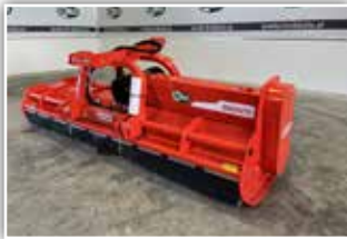
MASCHIO Bisonte 280 Mulcher – neues Modell , Neumaschine, Front- und Heckanbau, Hämmer, 2x Gegenschneiden, Freilauf im Getriebe, Stützwalze, Gelenkwelle, 1000 U/min, PVC Schutzgummi und Ketten