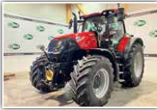
CASE IH Optum 300 CVX , Bj. 2022, 1065 h, Miettraktor, FH, FZW, Bereifung 600/70 R30 und 710/70 R42 Michelin Axiobib 2, 7x DW ZSTG, pneumatische Kabinenfederung, HMC 2 VGM, mit RTK Lenksystem