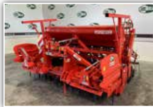
MASCHIO Sükombination DC 2500 / Dama 2500 New Edition , Neumaschine, Zahnpackerwalze, Corex Doppelscheibenschar, elektrische Fahrgassenschaltung, Striegel, Ladesteg, Gelenkwelle mit Rutschkupplung