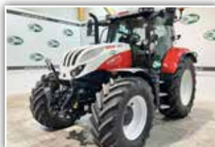
STEYR Profi 4145 S8 , Bj. 2023, 350 h, Vorführer, 50 km/h, 8-fach Lastschaltung, S-Tronic 2 Getriebe Software, 540/65 R28 vorne und 650/65 R38 hinten Michelin, FH, S-Guide Vorrüstung