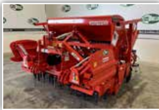
MASCHIO Sükombi DM 3000 / Dama 3000 , Neumaschine, Kreiselegge bis 180 PS, Combi/Trapezpackerwalze, Sämaschine mit Doppelscheibenschar und Andruckrolle, Striegel