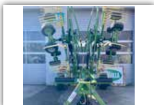
KRONE Swadro TC 640 , Ber. 15.0/55-17 AS, Hauptfahrwerk gelenkt, klappbare Zinkenarme, Tandemachse, Schwadttuch