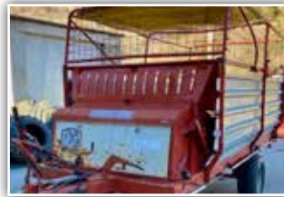
GRUBER Ladewagen LHS 28-13 , Dürrfutteraufbau, 1.250.- inkl. Verm.