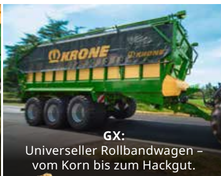
GX: Universeller Rollbandwagen – vom Korn bis zum Hackgut.