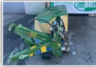
KRONE AM R 280 Heckmäherwerk