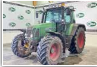
Fendt 712 TMS , Bj. 2007, 14.000 h, Trieb-satz überholt, Bereifung 600/60 R28 vorne und 710/60 R38 hinten, pneumatisch gefederte Kabine, 49.800,- inkl. Verm.