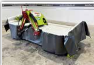
CLAAS Frontmäherwerk Disco 3150 F , Bj. 2022, Max Cut Mähbalken, Messerschnellwechsel, Schwadscheibe, Fördertrömmel links, Entlastungsfedern, neuwertiger Zustand, 14.400.- inkl. 20%