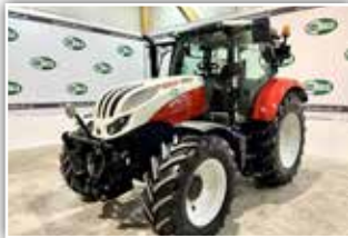
STEYR Profi 4115 , Bj. 2018, 1.660 h, Power Shuttle, 4-fach Lastschaltgetriebe, 5x DW ZSTG, Multicontrol-lerarmlehne mit integrierten Kreuzhebel, Bereifung 600/65 R38 Michelin, 82.800,- inkl. Verm.