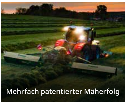
Mehrfach patentierter Mäherfolg