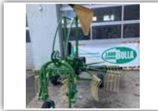
KRONE Swadro S 350 High Land , Tastrad vorne