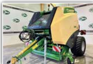
KRONE Comprima V 150 XC Plus , hydr. Bodenabsenkung, Druckluftbremse, Bereifung 500/55 – 20, Zentralschmierung, Bedienterminal CCI 800 Terminal, ISOBUS, K 80, Arbeitsbeleuchtung