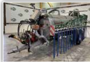
VAKUTEC Güllefass VA 8300 Pumpfass , Bj. 2002, 8300 Liter Inhalt, Bereifung 800/40 – 26.5, Druckluftanlage, Schleppschlauch 15 Meter, Saugarm, Saugtrichter, Rotacut, Eigenversorgung, 26.300.- inkl. Verm.