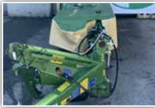
KRONE AM R 240 Heckmäherwerk , klappbarer Seitenschutz, Förder- und Mähscheibendeckel, Gelenkwelle