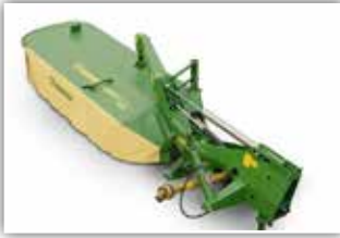
KRONE Easy Cut R 360 Heckmäherwerk , Gelenkwelle