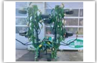
KRONE Vendro 820 , Tastrad vorne, hydr. Dämpfer, hydr. Vorgewendstellung, Beleuchtung