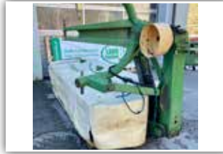
KRONE AM 283 S Heckmäherwerk , 3.900.- inkl. Verm.