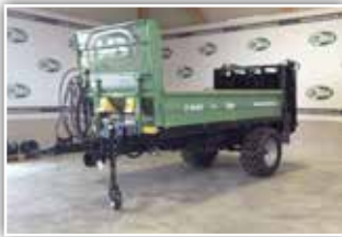
BRANTNER E 9545 Power Spread , Neumaschine, Bordwand 50 cm mit Holzleiste auf Bordwand, Druckluftanlage, Bereifung 5560/45 – 22.5