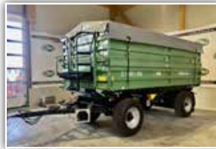
BRANTNER Z 18051/2 XXL , 40 km/h Ausführung, 2 Kippzylinder, 5 mm Stahlblechboden, 2x 80 cm Bordwände, BPW Achsen, Power Flex Dichtungssystem, Bereifung 385/65 R22.5 LKW Neu