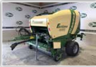
KRONE Fortima V 1500 MC , Bj. 2018, 5500 Ballen, Schneidwerk mit 17 Messer, Messergruppenschaltung, variable Ballenkammer, Druckluftbremse, Bereifung 480/45 – 17, Presse in gutem Zustand, 38.800.- inkl. Verm.