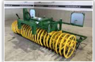
KERNER FP 300 , Neumaschine, Lenkbock, Packerwalze mit 65 cm Durchmesser, in Traktorspur 55 cm, 2-reihige Messerlege höhenverstellbar, LED Beleuchtung mit Wartafeln