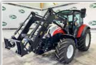
STEYR Kompakt 4090 , Bj. 2021, 100 h, 24/24 Gang 40 ECO Getriebe, Power Shuttle, Lastschaltung, FH, Bereifung 440/65 R20 vorne und 540/65 R30 Michelin, Hauer Frontlader, Traktor ist neuwertig, 79.500,- inkl. Verm.