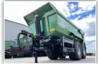
BRANTNER TA 20053 Halbpfe Schwerlast Muldenrückwärtskipper , 22 To Gesamtgewicht, BPW Pendelaggregat 30 to, Mulde aus Hardox, Bereifung 650/55 R26.5, LED Licht mit Gitterschutz