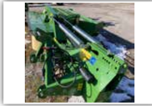
KRONE Easy Cut R 320 CV Heckmäherwerk