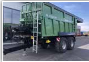
BRANTNER TA 23063 Power Push Plus , Neumaschine, 40 km/h Ausführung, BPW Achsen, Lenkachse, Federnstabilisator für Hinterachse, hydr. Unterfahrerschutz, hydr. Stirnwand, Sattelstützwinde