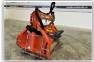
AUER Holzzege ST 1700 , mit Drehmotor, 3 Punkt Anbau, mechanisch teleskopierbar, Zangenöffnungsweite 170 cm