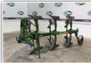
AMAZONE Cayros M 950 3-schar , Bj. 2017, Vorschüler, Pendelstützrad, Arbeitsbreite mechanisch einstellbar, Pflug in sehr gutem Zustand, 9.900.- inkl. Verm.