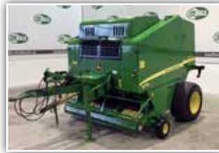
JOHN DEERE Rundballenpresse 578 , Bj. 2007, rund 15.500 Ballen, Netzbindung, Walzenpresssystem, Schneidwerk, Bereifung 19.0/45 – 17 Rille, Bedienmonitor, guter Zustand, 17.800.- inkl. Verm.