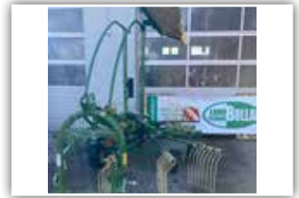
KRONE Swadro S 460 , Tastrad, hydr. Dämpfer, Beleuchtung

Preis auf Anfrage – Martin Schiefer 0676 84 50 65 800