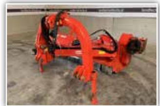
MASCHIO Giraffona 260 , Seitenmulcher, Bj. 2017, großes Modell, 260 cm Arbeitsbreite, außenliegendes Getriebe, hydr. schwenkbar, Stützwalze, Gleitkufen, neue Weitwinkelgelenkwelle, 8.700.- inkl. Verm.