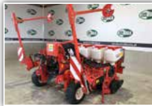
GASPARDO Maissämaschine Monica 6 Reihen ISOTRONIC , MTR Säaggregat mit Doppelscheibenschar, V Andruckrollen, variabler Reihenabstand 45/50/60/70/75 cm, elektrischer Säntrieb, Säüberwachung