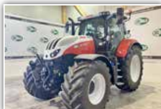
STEYR Impuls CVT 6175 , Bj. 2023, 500 h, Vorführer, FH, Bereifung 540/65 R30 und 650/65 R42, Easy Tronic 2, S-Tech 700 Plus, 360 Grad LED Scheinwerferpaket