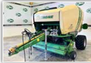
KRONE Comprima F 125 XC , Bj. 20, Ballen, fixe Ballenkammer, Druckluftbremse, 19.0/45 – 17 AS Profil, Schneidwerk, Rollenniederhalter, Weitwinkelgelenkwelle, guter Zustand, 27.500.- inkl. Verm.