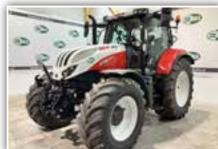
STEYR Profi 4125 S8 , Bj. 2023, 500 h, Miettraktor, 50 km/h, 8-fach Lastschaltgetriebe, gefederte Vorderachse, gefederte Kabine, 540/65 R28 vorne, 650/65 R38 hinten, Easy Tronic, S-Tech 700 Monitor