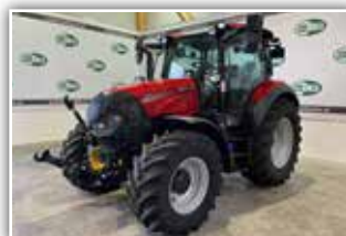
CASE IH Vestrum 110 CVX , Neumaschine, FH, FZW, gef. Vorderachse, gef. Kabine, Bereifung 480/65 R24 vorne und 600/65 R34 hinten, Druckluftanlage, Panoramadach, HMC 1 VGM