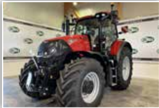
CASE IH Optum 250 CVX , Neumaschine, FH, Bereifung 600/70 R30 und 710/70 R42, 6x DW ZSTG, Load Sensing Anschlüsse, ISOBUS, HMC 2 VGM, Lenksystem vorbereitet, LED Scheinwerferpaket