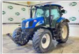
NEW HOLLAND T 6010 , Bj. 2008, 8.000 h, Fronthub-werk, Druckluftanlage, Klimaanlage, 33.800,- inkl. Verm.