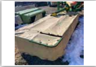
KRONE Easy Cut 320 R Heckmäherwerk , Gelenkwelle, 3.900.- inkl. Verm.