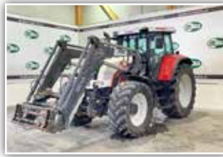
STEYR CVT 6195 Profimodell , Bj. 2008, 11.000 h, FH, Bereifung 540/65 R30 vorne und 650/65 R42 hinten, Load Sening Anschlüsse, 4x DW ZSTG, Hydrac Auto Lock Frontlader, 56.800,- inkl. 20%