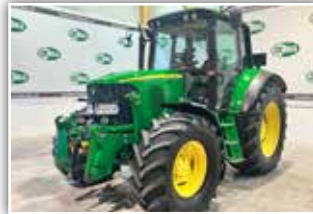
JOHN DEERE 6420 , Bj. 2002, 8.450 h, 44 km/h mit stufenlosen Auto Powr Getriebe, FH, FZW, gef. Vorder-achse, hydr. gef. Kabine, Bereifung 600/65 R38 hinten, Druckluftanlage, 49.500,- inkl. Verm.