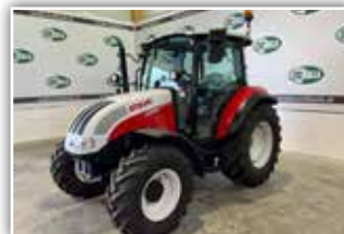
STEYR Kompakt 4065 S , Bj. 2024, Neumaschine, Synchro Shuttle Getriebe, Bereifung 540/65 R28 Michelin, 3x DW ZSTG, Luftsitz, ausstellbare Frontscheibe