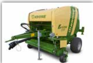
KRONE Fortima 1500 MC , Druckluftbremse, Bereifung 19.0/45 – 17 AS Profil, Zentralschmieranlage, ISOBUS Elektronik