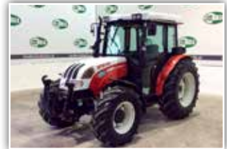
STEYR Kompakt 495 , Bj. 2006, 4.950 h, FH, 1 und 2 Leiter Druckluftanlage, 4x DW ZSTG, 2x Zusatzhubzy-linder, Bereifung 14.9 R20 vorne und 16.9 R30 hinten, Luftsitz, 34.800,- inkl. Verm.