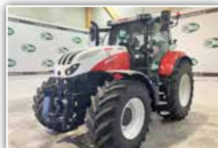
STEYR Absolut CVT 6200 , Bj. 2023, 20 h, Neumaschine, FH, Bereifung 600/65 R28 und 650/65 R42, Easy Tronic 2, S-Brake, 6x DW, S-Tech 700 Monitor, 360 Grad LED Scheinwerferpaket