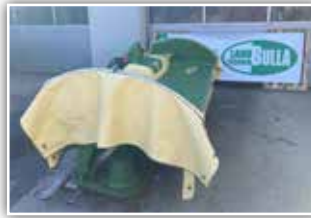
KRONE Easy Cut F 320 High Land Frontmäherwerk , Teleskopoberlenker II, Entlastungsfedern, Gelenkwelle