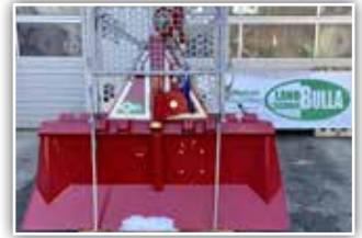
TAJFUN EGV 85 AHK SG Seilwinde , Neumaschine, Schildbreite 205 cm, Soma Profifunk, 110 Meter – 11 mm Forstseil, Seilendstück drehbar