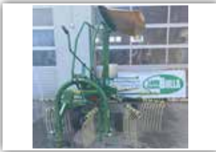
KRONE Swadro 38 , Tastrad vorne