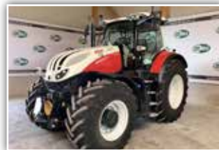
STEYR Terrus CVT 6300 S-Fleet , neues Modell, Bj. 2023, 550 h, Vorführer, FH, FZW, Bereifung 620/75 R30 und 710/75 R42 Michelin, S-Brake, 6x DW, hydr. Seitenstreben

Für nähere Infos kontaktieren Sie Ihren zuständigen Händler!