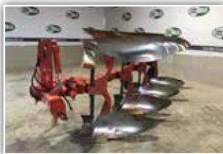
VOGEL & NOOT 4-schar Pflug MS 1050 , Scharabstand 105 cm, Pendelstützrad, gezacktes Scheibensech, Anlagenschoner auf alle Schare, Vorschüler, mechanische Arbeitsbreitenverstellung, 6.900.- inkl. Verm.