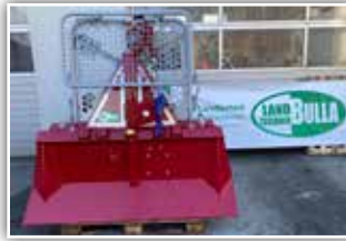
TAJFUN EGV 65 AHK SG Seilwinde , Neumaschine, Schildbreite 180 cm, Soma Profifunk, 110 Meter – 10 mm Forstseil, Seilendstück drehbar