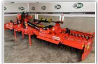
MASCHIO Aquila Classic 6000 Kreiselegge , hydr. klappbar, bis 300 PS, Krumpenpackerwalze, Gelenkwellen mit Nockenschaltkupplungen, Beleuchtung