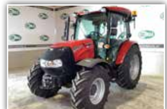
CASE IH Farmall 55 A , Neumaschine, Synchro Shuttle, Bereifung 375/75 R20 vorne und 420/85 R30 hinten, 2x DW ZSTG, höhenverstellbare Anhängervorrichtung, Luftsitz