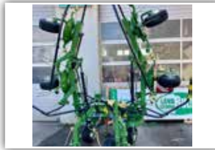
KRONE Vendro 620 , Stützrad vorne, hydr. Grenzstreueinrichtung