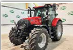
CASE IH Maxxum 150 CVX , Bj. 2023, 500 h, Vorführer, Bereifung 540/65 R28 und 650/65 R38, Lenksystemvorrüstung, FH, 6x DW ZSTG, HMC 2, Advanced Trailer Brake, AFS 700 Monitor