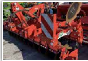
MASCHIO Veloce 300 Scheibenegge , Vorführgerät, 2 Reihe gezackte Scheiben mit 51 cm Durchmesser, hydraulische Tiefenstellung, Stabwalze, Beleuchtung, wenig gearbeitet