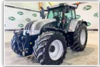
STEYR CVT 6190 Profimodell , Bj. 2004, 8.740 h, FH, gef. Vorderachse, gef. Kabine, Bereifung 600/65 R28 vorne und 710/70 R38 hinten, hydr. Oberlenker, Maschine in gutem Zustand, 64.800,- inkl. Verm.