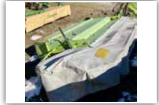
CLAAS Corto 270 S Heckmäherwerk , Gelenkwelle, 1.850.- inkl. Verm.