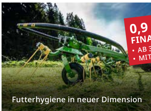
Futterhygiene in neuer Dimension