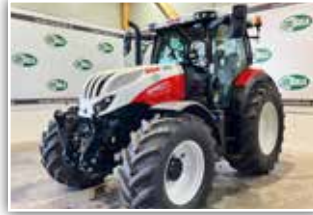
STEYR Profi 6145 CVT , Bj. 2022, 150 h, 50 km/h stufenlos Getriebe, FH, 540/65 R28 vorne und 650/65 R38 hinten, 125.800,- inkl. 20%