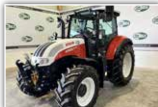
STEYR Multi 4100 , Bj. 2023, 250 h, Miettraktor, FH, Bereifung 440/65 R24 vorne und 540/65 R34 hinten, gefederte Vorderachse, gefederte Kabine, 3x DW ZSTG, DLA, Klimaanlage