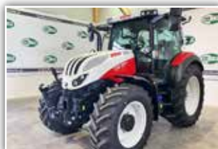
STEYR Expert CVT 4110 , Bj. 2024, Neumaschine, Bereifung 440/65 R28 vorne und 540/65 R38 hinten, FH, gefederte Vorderachse, gefederte Kabine, FH, Multicontroller II Armlehne, neue Generation