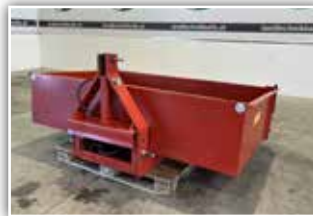
FRITZ Oststeirer Hecklade , Breite 200 cm, Tiefe 120 cm, Bordwandhöhe 40 cm, Kippzylinder einfachwirkend, Bordwand abnehmbar, 1.400.- inkl. Verm.