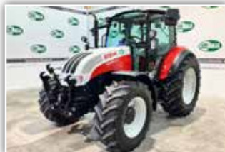
STEYR Kompakt 4100 HD , Bj. 2024, Neumaschine, Power Shuttle, Lastschaltung, 40 km/h Eco Getriebe, breite Vorder- und Hinterachse in stärkerer Ausführung, FH, FZW, Multicontroller, Klimaanlage