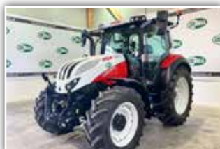
STEYR Expert CVT 4120 , Bj. 2024, Vorführer, FH, 440/65 R28 vorne und 540/65 R38 hinten, Easy Tronic VGM, Klima, DLA, 6x DW ZSTG, Multicontroller 2 Armlehne, LED Scheinwerfer, neue Generation