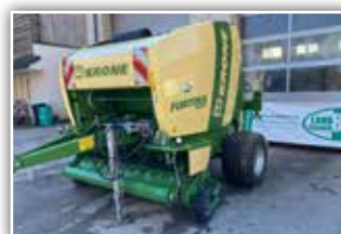
KRONE Fortima 1250 MC , Druckluftbremse, Bereifung 19.0/45 – 17 Rille, Zentralschmieranlage, Bedienterminal DS 500