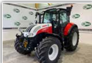
STEYR Multi 4120 Stufe V , Bj. 2024, Neumaschine, FH, FZW, Bereifung 480/65 R24 vorne und 600/65 R34 hinten Michelin, 6x DW, DLA, Klimaanlage, gefederte Vorderachse, gefederte Kabine