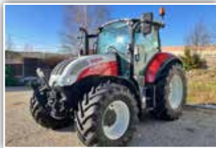
STEYR Multi 4120 , Bj. 2021, 850 h, gef. Vorderachse, gef. Kabine, Bereifung 480/65 R24 vorne und 600/65 R34 hinten, 82.500,- inkl. Verm.