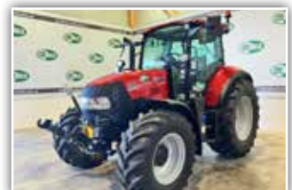
CASE IH Luxxum 100 , Neumaschine, FH, FZW, Druckluftanlage, Klimaanlage, 5x DW ZSTG, gef. Vorderachse, gef. Kabine, Bereifung 480/65 R24 vorne und 600/65 R34 hinten