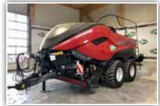
CASE IH Quaderballenpresse LB 436 HD , Bj. 2021, 2500 Ballen, Bereifung 600/55 R22.5, ISOBUS Elektronik, hydr. Klappbare Garnkästen, Wiegesystem, LED Beleuchtung, Maschine ist neuwertig, 193.800.- inkl. 20%