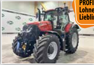
CASE IH Puma 260 CVX , AFS Connect, neues Modell, Bj. 2024, Neumaschine, FH, Bereifung 600/70 R30 und 710/70 R42 Michelin, S-Brake, hydr. Kabinenfederung