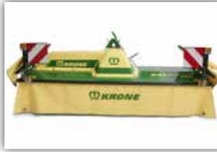
KRONE Easy Cut F 360 Frontmäherwerk