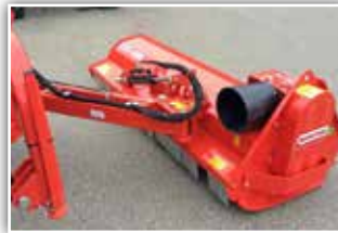
MASCHIO Giraffa 210 XL Seitenmulcher, Vorführmaschine , Antriebsgetriebe außenliegend, Gleitkufen, 540 U/min, Stützwalze, Gegenschneide, Arbeitsbreite 210 cm, hydr. Neignungsverstellung +90 bis -65 Grad