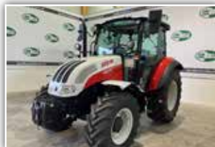
STEYR Kompakt 4075 S , Bj. 2024, Neumaschine, Power Shuttle Getriebe, 5x DW ZSTG mit Kreuzhebel, Bereifung 540/65 R28 Michelin, Klimaanlage, Luftsitz