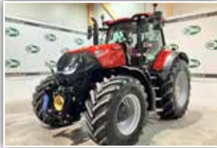
CASE IH Optum 300 CVX , Bj. 2022, 1065 h, Miettraktor, FH, FZW, Bereifung 600/70 R30 und 710/70 R42 Michelin Axiobib 2, 7x DW ZSTG, pneumatische Kabinenfederung, HMC 2 VGM, ohne RTK Lenksystem