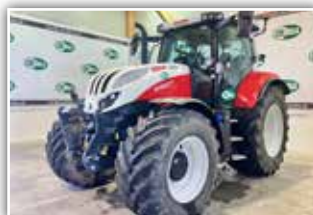
STEYR Profi 6150 CVT , Bj. 2023, 450 h, Vorführer, Bereifung 600/60 R28 und 710/60 R38 Trelleborg, S-Guide Lenksystem auf RTK, FH, FZW, Easy Tronic 2, S-Brake