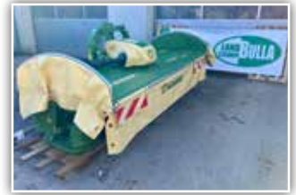
KRONE Easy Cut F 320 >Generation 3< Frontmäherwerk , Teleskopoberlenker Kat. II, Beleuchtung