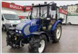
FARMTRAC 555 DT , Bj. 2014, 170 h, FH, Bereifung 365/70 R18 vorne und 14.9 R28 hinten, 4x DW, Kreuzhebel, Leitungen nach vorne, neuwertiger Zustand, 18.800. inkl. Verm.