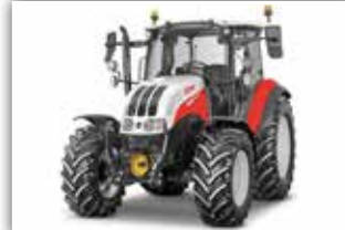
STEYR Kompakt 4100 , Neumaschine, Stufe V - neue Motorgeneration, Bj. 2022, 40 km/h ECO Getriebe, Power Shuttle, Lastschaltung, Bereifung 440/65 R24 und 540/65 R34, 5x DW mit Kreuzhebel