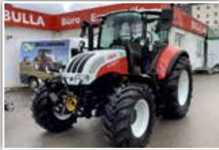
STEYR Multi 4110 , Bj. 2020, 700 h, Vorführer, Bereifung 480/65 R24 vorne und 600/65 R34 hinten, gef. VA, gef. Kab., FH und FZW, 6x DW, 100 l/min Pumpe, Premium Luftsitz, Parkbremse, LED Arbeitsscheinwerfer, S-Stop