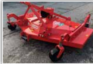
MASCHIO Jolly 210 Sichelmäher , Neumaschine, Bj. 2022, 3 Sichelblätter, 4 Tiefenführungsrollen höhenverstellbar, GW