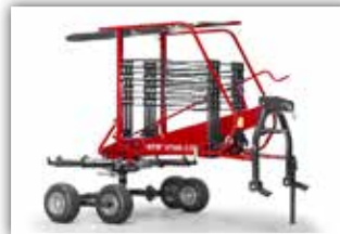
SIP Star 430/12 Schwader , Neumaschine, Bj. 2021, 12 Zinkenarme, Arbeitsbreite 4,3 Meter, Tastrad, GW