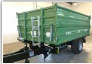
BRANTNER E 8041 , Neumaschine, Bj. 2022, 25 km/h Typisierung, 2x 60 cm Bordwände, Pendelwände, Bordwandhebefedern, Bereifung 500/55 R17, Druckluftanlage