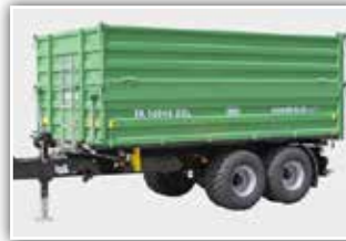
BRANTNER TA 16045 XXL , Neumaschine, Bj. 2022, 25 km/h Typisierung, 2x 80 cm Bordwände, Bordwandversteifung, Bordwandhebefedern, Bereifung 445/45 R19.5 NEU, Sattelstützwinde