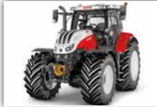
STEYR Impuls CVT 6175 , Neumaschine, Bj. 2022, Bereifung 600/65 R28 vorne und 650/65 R42 hinten, S-Guide RTK Lenksystem, S-Brake, 20 LED Scheinwerfer, 6x DW, Grammer Dual Motion