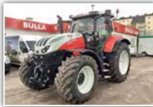
STEYR Absolut CVT 6240 , Bj. 2022, Neumaschine, S-Guide Lenksystem mit RTK, 710/60 R42 Michelin Axiobib 2, FH und FZW, pneu. Kabinenfederung, 7x DW, S-Brake, S-Tronic Steuerung