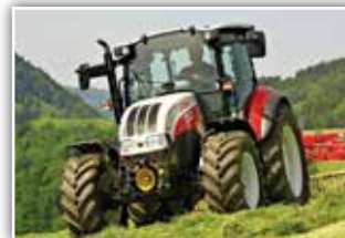
STEYR Kompakt 4090 , Stufe V, Bj. 2022, 150 h, Fahr- schultraktor, 24/24 Power Shuttle mit Lastschaltung, 40 Eco Getriebe, Bereifung 440/65 R24 vorne und 540/65 R34 hinten, FH und FZW, 5x DW mit Kreuzhebel, DLA, Klima