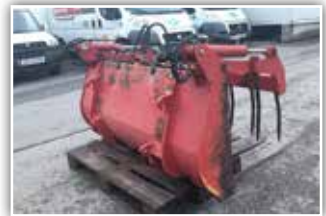
HYDRAC Silagreifzange 180 cm Breite , doppelt wirkend betätigter Zylinder, 1.850.- inkl. Verm.