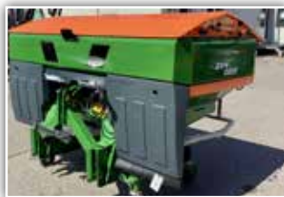
AMAZONE ZA-V 2000 Wiegestreuer , Neumaschine, Bj. 2022, Profis Control Computer, Limiter Grenzstreueinrichtung, Neigungssensor, Leermeldesensoren, Roll- und Abstellvorrichtung, Rollplane