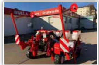
GASPARDO Monica , Neumaschine, Bj. 2021, 6 reihig, hydraulisch teleskopierbar, Reihenabstände 45 / 50 / 70 / 75 cm möglich, Transportbreite 255 cm, ohne Düngertank, hydr. Spuranzeiger, Samen- und V-Andruckrollen, ISOBUS