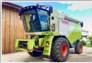
CLAAS Tucano 420 , Bj. 2018, 440 Motor- und 290 Trommelstunden, 245 PS Mercedes Motor, Bereifung 800/65 R32, Auto Contour, 3-D Siebe elektrisch einstellbar, autom. AHV, Special Cut Häcksler, Klimaautomatik, High End Beleuchtung