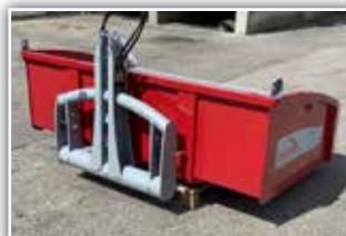
ROSENSTINER Heckladen , Neumaschinen, Bj. 2021 und Bj. 2022, Kendo 160, Judo 180, 200, 220, Samuraj 220 mit Bordwandschwenkvorrichtung