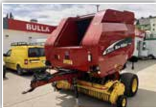
NEW HOLLAND BR 750 Rundballenpresse , Bj. 2004, 15 Messer, 220 cm Pick Up, variable Ballengröße, Druckluftanlage, Netzbindung, 11.900.- inkl. Verm.