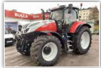
STEYR Absolut CVT 6240 , Bj. 2022, Neumaschine, S-Brake, S-Guide Lenksystem mit RTK, 710/60 R42 Michelin Axiobib 2, FH, pneu. Kabinenfederung, 7x DW, S-Tronic Steuerung