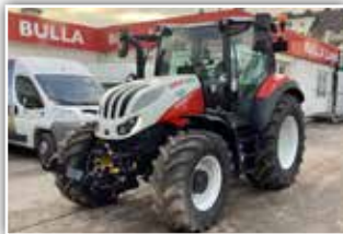
STEYR Expert CVT 4120 , Bj. 2020, 500 h, Vorführer, gef. VA, gef. Kab., FH und FZW, Bereifung 480/65 R24 vorne und 600/65 R34 hinten, Multicontroller 2 Armlehne, Panoramadach, Grammer Dual Motion, 6x DW