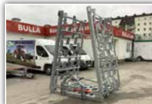
WÖLFLEDER Wiesenegge , Neumaschine, Bj. 2019, 8,3 Meter Arbeitsbreite, hydraulische Klappung