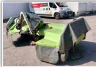
CLAAS Mähwerk Corto 3150 F Profil , Bj. 2007, Entlastungsfedern, Gelenkwelle, 3.750.- inkl. Verm.