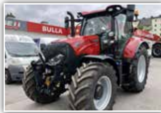
CASE IH Maxxum CVX 150 , Bj. 2022, 200 h, Vorführer, 50 km/h, gef. VA, gef. Kab., Bereifung 540/65 R28 vorne und 650/65 R38 hinten, 5x DW, Grammer Dual Motion, AFS 700 Monitor, FH und FZW, HMC 2