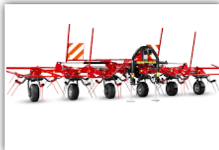
SIP Spider 615/6 Zettwender , Neumaschine, Bj. 2021, 6 Meter Arbeitsbreite, 6 Kreisel, Tastrad, Beleuchtung