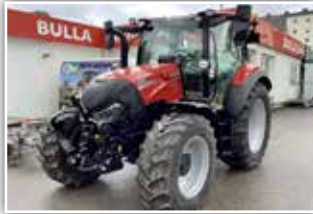
CASE IH Vestrum CVX 100 , Neumaschine, Bj. 2022, gef. VA, gef. Kab., Bereifung 440/65 R28 vorne und 540/65 R38 hinten, LED Arbeitsscheinwerfer, 5x DW