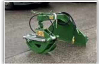
BIG LIFT 250 Holzange , Neumaschine, Bj. 2021, hydraulische Öffnung 140 cm, Verzahnung gegen Verrutschen, 90 Grad auf bei Seiten verschwenkbar, parallele Zugreifen zum mechanischen Ausgleich