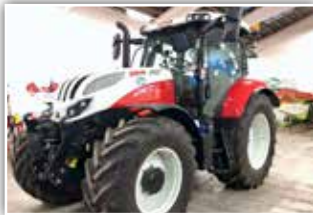
STEYR Profi CVT 4135 , Neumaschine, Bj. 2022, Vollausrüstung, S-Guide RTK Lenksystem, S-Brake, Bereifung 540/65 R28 vorne und 650/65 R38 Michelin, FH und FZW, S-Tech 700 Monitor mit S-Brake, Deluxe Kabine