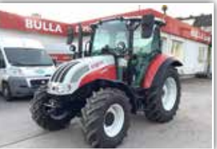
STEYR Kompakt S 4065 , Neumaschine, 12/12 Power Shuttle Getriebe, 40 km/h, Bereifung 380/75 R20 vorne und 540/65 R28 hinten Michelin, 3x DW, Zusatzhubzylinder, Drehlicht, Luftsitz, Klima