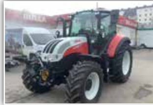
STEYR Multi 4100 , Neumaschine, neues Modell, Bereifung 440/65 R24 vorne, 540/65 R34 hinten, FH, gef. VA, gef. Kab., LED Arbeitsscheinwerfer, DeLuxe Kabine, DLA, Klima, Parkbremse