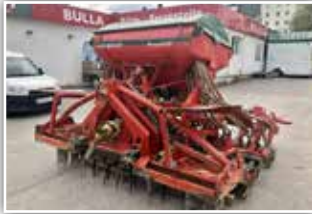
VOGEL & NOOT Säukombination , Bj. 2002, Kreiselegge Arterra 300, Gelenkwelle mit Nockenschaltkupplung, Zahnpackerwalze, pneumatische Sämaschine Power Drill 300, Doppelscheibenschar, Striegel, 10.800,- inkl. Verm.