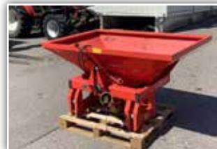
RAUCH MDS 701 Düngerstreuer , Bj. 1993, hydraulische Schieberöffnung, Gelenkwelle, guter Zustand, 1.550,- inkl. Verm.