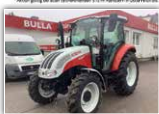
STEYR Kompakt S 4065 , Neumaschine, 12/12 Synchro Shuttle Getriebe, 40 km/h, Bereifung 360/70 R20 vorne und 420/70 R30 hinten, 3x DW, Zusatzhubzylinder, Luftsitz