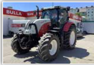
STEYR CVT 6145 , Bj. 2012, 6.800 h, 50 km/h - stufenloses Getriebe mit Parkbremse, gef. VA, gef. Kab., Bereifung 540/65 R28 vorne und 650/65 R38 hinten, 4x DW, hydr. DL, FH, Quicke FL Konsole, 65.800.- inkl. Verm.