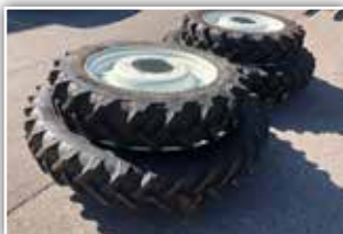
Pflegeräder von STEYR Kompakt Eco Tech , Dimension 230/95 R42, 250/85 R28 Ringverstellfelge, neuwertige Garnitur, Spur ca. 155 cm, verstellbar bis 180 cm, 3.980,- inkl. Verm.