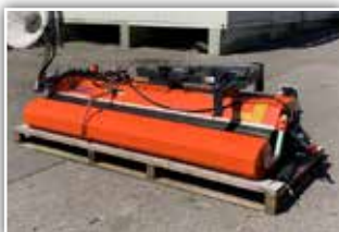
TUCHEL Eco 520/260 , Neumaschine, Bj. 2021, 260 cm gerade und 244 cm schräge Arbeitsbreite, Seitenbesen, hydraulische Schmutzladenöffnung, 3 Punkt Anhängung mit 3ten Stützrad, hydraulischer Antrieb