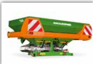
AMAZONE ZA-M 1002 Easy Set 2 , Neumaschine, Bj. 2022, Limiter rechts, OM 10 - 16 Streuscheiben, Einfüllschiebe, GW, Beleuchtung