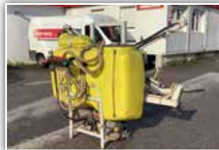
JESSUR Feldspritze , mechanisch klappbar, mechanisch höhenverstellbar, 5 Teilbreiten mechanisch, Gelenkwelle, 890,- inkl. Verm.