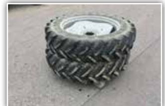
Pflegeräder von STEYR Kompakt 4075 Mitteltonnel, Dimension 320/85 R36 bzw. 12.4 R36, Räder mit Verstellfelge, Spur einstellbar, Räder in gutem Zustand, 1.550,- inkl. Verm.