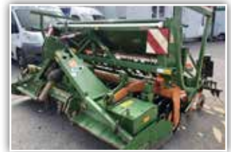
AMAZONE Säukombination KG 303 / AD 303 Special, Bj. 2002, Kreiselgrubber in starker Ausführung, Keilringwalze, RoTeC Scheibenschar, Exaktstriegel, stufenloses Getriebe elektrisch einzustellen, 14.800,- inkl. Verm.