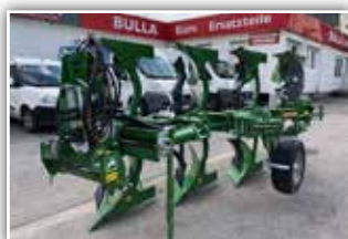
AMAZONE Cayros XM-V Pflug 4 Schar , Neumaschine, Bj. 2021, Molblech WL 430 mit Meißel, Einschwenkvorrichtung Scharabstand 95 cm, Rahmenhöhe 82 cm, Schnittbreite hydraulisch verstellbar, Doppelstützrad Blech 500 mm