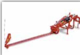
GASPARDO Fiore 205 Seitenmäherwerk , Neumaschine, Bj. 2021, Arbeitsbreite 205 cm, Fingermähhaken, hydraulisch anhebbar, komplett mit Tragrahmen, Reservemesser