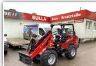
SCHÄFFER Hoflader 3650SLT , Neumaschine, Bj. 2022, 50 PS Dieselmotor, Bereifung 31x15.5 - 15 AS mit ET 70 mm, Euro Aufnahme, Selbstperrdifferential in Vorder- und Hinterachse