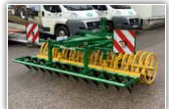
KERNER FP 300 Frontpacker , Neumaschine, Bj. 2021, 2 reihige Messeregge vorne, Beleuchtung