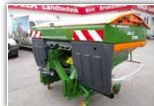
AMAZONE ZA-V 1700 Wiegestreuer , Neumaschine, Bj. 2022, ISOBUS, Limiter Grenzstreueinrichtung, Neigungssensor, Leermeldesensoren, Roll- und Abstellvorrichtung, Rollplane