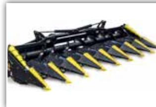
OLIMAC Drago GT , Neumaschinen von 4 bis 16 Reihen, gedämpfte selbstjustierende Pflückplatten, gehärtete Pflückschienen, 70 bis 80 cm Reihenabstand, Unterbauhäcksler horizontal doppelt ausgeführt, Ersatzteilstützpunkt in Sierning