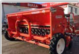
GASPARDO NINA 300 Sämaschine , Neumaschine, Bj. 2022, 3 Meter, Doppelscheibenschar Corex, elektrische Fahrgassenschaltung, stufenloses Getriebe, Striegel, Beleuchtung