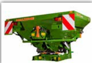
AMAZONE ZA-X 903 , Neumaschine, Bj. 2022, Grenzstreuschaufel, Einfüllschiebe, hydraulisch betätigt