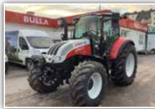
STEYR Multi 4120 , neues Modell, Bj. 2022, Vorführer, Bereifung 480/65 R24 vorne und 600/65 R34 hinten, LED Arbeitsscheinwerfer, Drehlicht, DLA, Klima, FH, gef. VA, gef. Kab., S-Stop, DeLuxe Luftsitz, 5x DW, 100 l/min Pumpe