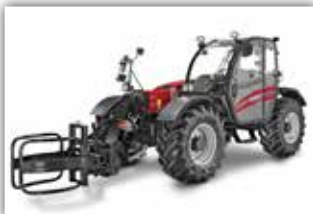
CASE IH Farmlift 742 , Neumaschine, Bj. 2022, 6x3 Powershift Getriebe mit Wandler und Schaltautomatik, Allradlenkung, Umkehrlüfter, Bereifung 460/70 R24 Trelleborg, LED Arbeitsbeleuchtung, autom. AHV