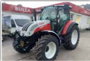
STEYR Kompakt 4080 , Stufe V, Bj. 2021, 350 h, Vorführer, 24/24 Power Shuttle mit Lastschaltung, 40 Eco Getriebe, Bereifung 440/65 R20 vorne und 540/65 R30 hinten, FH und FZW mit EFH, 4x DW mit Kreuzhebel, DLA, Klima, EHR