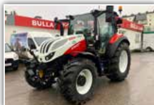
STEYR Expert CVT 4130 , Neumaschine, gef. VA, gef. Kab., Bereifung 480/65 R24 vorne und 600/65 R34 hinten, 4x DW, Panoramadach, 12 LED Arbeitsscheinwerfer