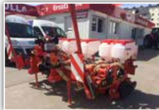
GASPARDO MTR , Neumaschine, Bj. 2020, 6 reihig, hydraulisch teleskopierbar, MTR Säaggregat bis 150 kg Scharndruck, Düngertank, Saatgutbehälter 60 Liter, Samen- und V-Andruckrollen, hydr. Spuranzeiger, ISOBUS