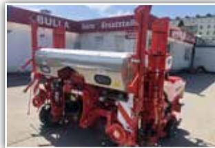
GASPARDO Maga Maissämaschine , Neumaschine, Bj. 2021, 7 reihig, mögliche Reihenabstände 45 / 50 / 60 / 70 / 75 cm, MTR Säaggregat bis 150 kg, Düngertank, 60 Liter Saatgutbehälter, Samen- und V-Andruckrollen, ISOBUS