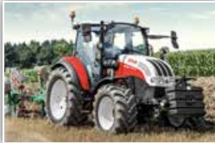
STEYR Kompakt 4110 HD , Neumaschine, Stufe V - neue Motorgeneration, Bj. 2022, HD Achsen mit mehr Spurweite, 40 km/h ECO Getriebe, Power Shuttle, Lastschaltung, Bereifung 440/65 R24 und 540/65 R34, 5x DW mit Kreuzhebel