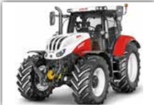
STEYR Profi CVT 6150 , Neumaschine, Bj. 2022, neues Modell, Bereifung 650/65 R38 hinten und 540/65 R28 vorne, 5x DW, FH und FZW, Grammer Dual Motion, Easy Tronic 2, S-Tronic Steuerung, ISOBUS