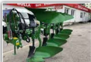
AMAZONE Cayros XMS-V Pflug 5 Schar , Neumaschine, Bj. 2021, Molblech WL 430 mit Meißel, Einschwenkvorrichtung, Scharabstand 105 cm, Rahmenhöhe 82 cm, Schnittbreite hydr. verstellbar, Pendelstützrad 680 mm