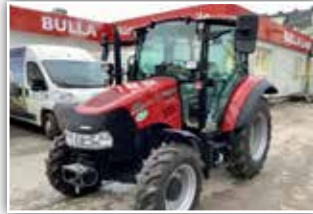
CASE IH Farmall 55 C , Neumaschine, Bj. 2022, 12/12 Synchro Shuttle Getriebe, 40 km/h, Bereifung 280/85 R20 vorne und 380/85 R28 hinten, Luftsitz mit Horizontalfederung, 3x DW, Zusatzhubzylinder