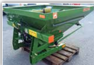
AMAZONE ZA-X 602 , Neumaschine, Bj. 2022, Grenzstreuschaufel, Einfüllschiebe, hydraulisch betätigt