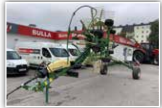
KRONE Swadro TS 620 Doppelschwader , Bj. 2019, neuwertiger Zustand, Bereifung 15.0/55 - 17, 2x Kreisell mit je 13 Zinkenarme, Arbeitsbreite 6,2 Meter, 21.200.- inkl. Verm.