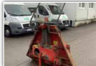
HOLZKNECHT HS 260 , Bj. 2008, 5 Tonnen Zugkraft, Anhängervorrichtung, 2x Würgekettens, Schutzgitter, 1.380,- inkl. Verm.