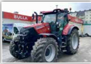
CASE IH Puma CVX 200 , Bj. 2021, 400 h, Vorführer, APM Fahrmodus, Bereifung 600/60 R30 vorne und 710/60 R42 Trelleborg TM 1060, AFS 700 Monitor, Accu Guide RTK Lenksystem, HMC 2, 20 LED Arbeitsscheinwerfer