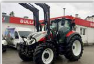
STEYR Expert CVT 4130 , Bj. 2021, 450 h, Vorführer, HYDRAC Frontlader EK 2200 XL, Bereifung 480/65 R28 vorne und 600/65 R38 hinten, Multicontroller 2 Armlehne, S-Tech 700 Monitor mit Easy Tronic 2, S-Guide Vorrüstung