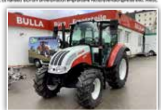
STEYR Kompakt S 4065 , Neumaschine, 12/12 Synchro Shuttle Getriebe, 40 km/h, Bereifung 360/70 R20 vorne und 420/70 R30 hinten, 3x DW, Zusatzhubzylinder, Luftsitz