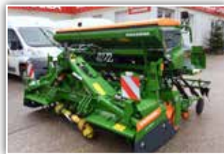
AMAZONE Säkombination KE 3001 Super/Catya 3000 Special RoTeC , Neumaschine, Bj. 2021, 24 Schare, mechanischer Säantrieb, Amalg+ Fahrgassenschaltung, Zahnpackerwalze