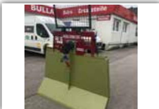
HOLZKNECHT HS 650 Seilwinde , Neumaschine, Bj. 2021, 6,5 Tonnen Zugkraft, 100 Meter - 10 mm gehämmert mit Parallelhaken, Autec Funk, Seilausstoß hydraulisch, Schildbreite 175 cm, Kipp Stop