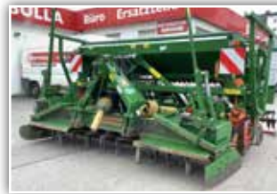
AMAZONE Säukombination , KE 3000 Super / AD 3000 Super, Bj. 2012, Kreiselegge starke Ausführung, Sämaschine mit großem Behälter, Güttler Walze, Spuranzeiger, Voraufmarkierer, Exaktstriegel, 19.800,- inkl. 20% UST