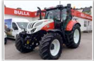
STEYR 6145 S8 , Neumaschine, 24/24 - 8 fach Lastschaltgetriebe, 50 km/h, Bereifung 540/65 R28 vorne und 650/65 R38, S-Guide Lenksystemvorrüstung mit Quick Turn 2, S-Tech 700 Monitor, 6x DW, Grammer Dual Motion