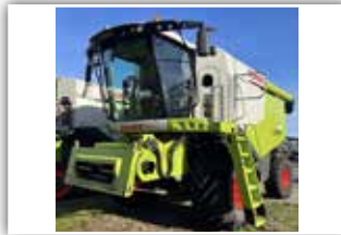
CLAAS Lexion 620 , Bj. 2019, 750 Motor- bzw. 350 Trommelstunden, Mercedes Motor, Schneidwerk V 620 mit Rapstrenner, Claas SW-Wagen, 800/70 R32 und 500/85 R24, 3-D Siebe, Staubabsaugung, Spreuvverteiler, Special Cut