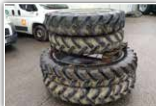
Pflegeräder von Claas Ares , Dimension 270/95 R48, 270/95 R32, Spur 210 cm, 2.850,- inkl. Verm.