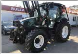
NEW HOLLAND TS 100 A Delta , Bj. 2007, 7400 h, 16/16 Gang 4 fach Lastschaltgetriebe, Power Shuttle, EHR, Klima, Hydrac Frontlader Auto Lock 2300, Single Ventil, Leichtgutschaufel, Forstverbauten, 43.800.- inkl. 20% UST