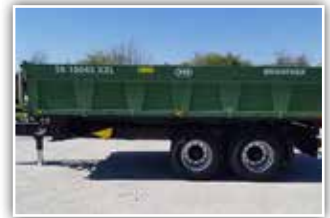
BRANTNER TA 20051/2 XXL , Neumaschine, Bj. 2022, 40 km/h - 21 Tonnen Typisierung, 5mm Hardox Boden, 1x Stabilator Bordwand 60 cm mit 4mm Hardox, hydr. Rückwand, Bereifung 445/65 R22.5 NEU, BPW Achsen 410x180