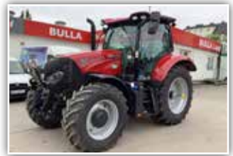
CASE IH Maxxum 125 , Neumaschine, 24/24 - 8 fach Lastschaltgetriebe, 50 km/h, Parkbremse, Bereifung 480/65 R28 vorne und 600/65 R38 hinten, Verstellachse, 6x DW, Lenksystemvorrüstung