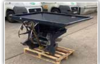
BOGBALLE Düngerstreuer , Inhalt 500 Liter, mechanische Schieberöffnung, Gelenkwelle, 170,- inkl. Verm.