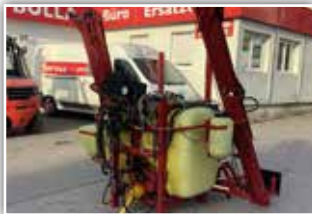
HARDI Feldspritze , 900 Liter, 12 Meter Arbeitsbreite, hydr. höhenverstellbar, hydr. klappbar, 5 Teilbreiten elektrisch geschaltet, 3 fach Düsenkopf, Beleuchtung, Gelenkwelle, 2.200,- inkl. Verm.