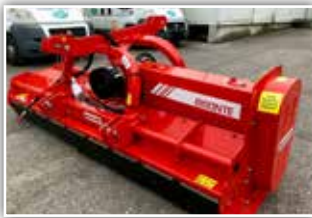
MASCHIO Bisonte 280 Mulcher , Bj. 2021, neues Modell, Vorfürher, Front- und Heckgerät, hydr. Seitenvershub, Freilauf integriert, Walze, Hämmer, GW