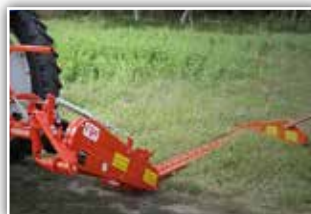
GASPARDO Fiore 235 Seitenmäherwerk , Neumaschine, Bj. 2021, Arbeitsbreite 235 cm, Fingermähhaken, hydraulisch anhebbar, komplett mit Tragrahmen, Reservemesser