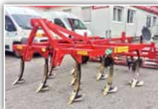
BRIX Wotan 300 Grubber , Bj. 2020, Vorführer, 10 Zinken mit Grubberschare und Flügeln, Scheibenfeld gezackt - seitlich hochklappbar, Stabwalze, Beleuchtung