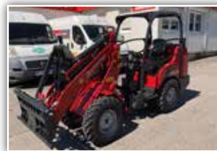
SCHÄFFER Hoflader 2028 SLT , Neumaschine, Bj. 2021, 25 PS Dieselmotor, Bereifung 7.00-12 AS oder Breitreifen möglich, Ölkühler, Heckgewicht Endplatte, 1x LED Arbeitsscheinwerfer, Schnellwechselrahmen mit hydr. Verriegelung