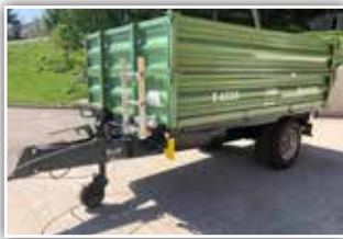
BRANTNER E 6535 , Neumaschine, Bj. 2022, 2x 50 cm Bordwände, Auslaufschieber, Bereifung 15.0/55 - 17