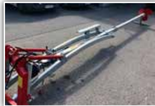
VAKUTEC TMH Profi 6 Meter GÜllemixer , Neumaschine, Bj. 2021, massives 4 Kant Rohr, Neigungsverstellung hydraulisch, Stützfußverbreiterung, Schwenkeinrichtung hydraulisch, Rührflügel HE 25