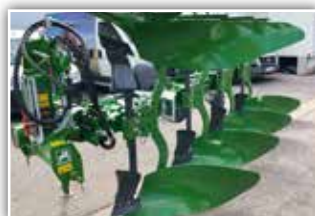
AMAZONE Cayros M Pflug 4 Schar , Neumaschine, Bj. 2021, Molblech WL 430 mit Meißel, Scharabstand 95 cm, Rahmenhöhe 78 cm, Schnittbreite einstellbar 36/40/44/48 cm, Doppelstützrad Blech 500 mm