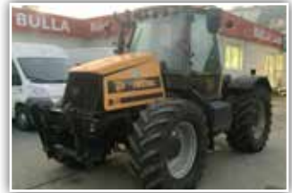
JCB 1115 , Bj. 1995, 7700 h, 50 km/h Fahrgeschwindigkeit, Lastschaltgetriebe, FH und FZW, Bereifung 540/65 R30, 26.500.- inkl. Verm.