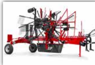
SIP Star 850/26 T Zweikreisel Mittelschwader , Bj. 2021, Vorführer, Arbeitsbreite 8,5 Meter, 13 Zinkenarme pro Kreisel, GW