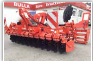
MASCHIO Veloce 300 Kurzscheibenegge , Neumaschine, Bj. 2022, gezackte Scheiben 510 mm, Seitenbleche, Randscheiben klappbar, hydraulische Tiefeneinstellung, Stabwalze 450 mm