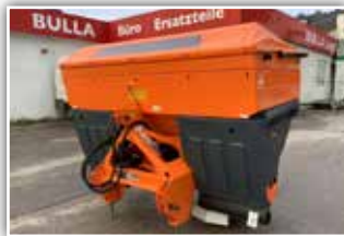
AMAZONE Ice Tiger Winterdienststreuer 1300 , Easy Set Bediencomputer, Optional mit ISOBUS Steuerung, Kamerasystem, Abdeckplane, Abstell- und Rollvorrichtung, LED Arbeitsscheinwerfer Innen und Außen, Drehleuchte