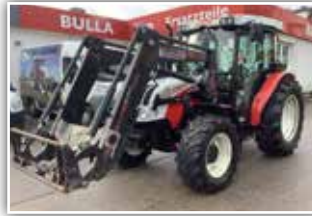
STEYR Kompakt 4095 , Bj. 2012, 3700 h, Hydrac Ek 2100 Frontlader mit Parallelführung, Kreuzhebel, Power Shuttle und Lastschaltgetriebe, hydr. Anhängerbremse, 3x DW, 41.500.- inkl. Verm.