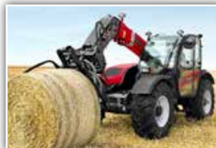
CASE IH Farmlift 742 , Bj. 2022, 150 h, Vorführer, 6x3 Powershift Getriebe mit Wandler und Schaltautomatik, Allradlenkung, Umkehrlüfter, Bereifung 460/70 R24 Trelleborg, LED Arbeitsbeleuchtung, autom. AHV