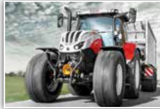
STEYR Profi CVT 6150 , Neumaschine, Bj. 2022, neues Modell, Vollausrüstung, S-Guide RTK Lenksystem, S-Brake, Bereifung 600/60 R28 vorne und 710/60 R38 hinten, FH und FZW, S-Tech 700 Monitor mit S-Brake, Deluxe Kabine