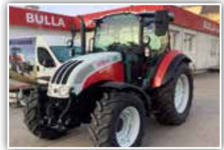
STEYR Kompakt 4075 : Bj. 2020, 500 h, 24/24 Gang Power Shuttle und Lastschaltgetriebe, FH, Klima, DLA, EHR, 440/65 R24 vorne und 540/65 R34 hinten, 3x DW, 58.500.- inkl. Verm.