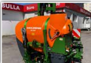
AMAZONE UF 901 , Neumaschine, Bj. 2022, Amaspray+ Bordcomputer, geschwindigkeitsabhängig, 15 Meter Q-Plus Gestänge, Düsenrohr