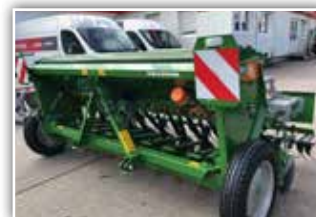
AMAZONE D9 3000 Sämaschine , Schulmaschine Neu, Bj. 2021, 21 RoTeC Schare, Amalg+ Fahrgassenschaltung, Exaktstriegel, Ladesteg und Beleuchtung