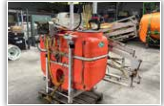
JESSERNIGG Automatik , Inhalt 660 Liter, 12 Meter Arbeitsbreite, hydraulisch klappbar, mechanisch höhenverstellbar, 5 Teilbreiten elektrisch geschaltet, Gelenkwelle, 2.480,- inkl. Verm.