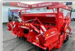
MASCHIO Säkombination DC Classic 3000 / Dama 3000 New Edition , Neumaschine, Bj. 2020, 3 Meter, Kombipackerwalze, 24 Doppelscheibenschar Corex Plus mit Samenandruckrollen, Striegel, GW mit Nockenschaltkupplung