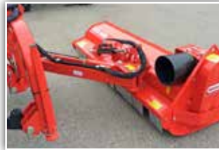
MASCHIO Giraffa 210 SE Seitenmulcher , Neumaschine, Bj. 2021, Auslegermulcher seitlich und hochstellbar, Getriebe außen, Hämmer, Walze, WWGE