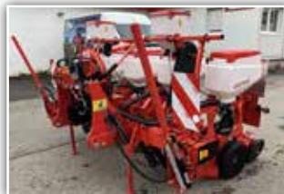
GASPARDO MTR , Neumaschine, Bj. 2021, 4 reihig, ohne Düngertank, Mikrogranulatstreuer 2x 30 Liter, MTR Säaggregat, Samen- und V-Andruckrollen, hydr. Spuranzeiger, ISOBUS mit Säüberwachung