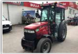
CASE IH JX 1075 V Profimodell 2 , Bj. 2006, 2400 h, 32/16 Power Shuttle und Lastschaltgetriebe, Klima, EHR, Bereifung hinten 320/85 R24, Außenbreite 125 cm, Kommunalplatte, 23.500.- inkl. Verm.