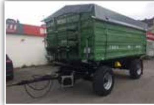
BRANTNER Z 18051/2 XXL , Neumaschine 2022, 40 km/h Typisierung, 2x 80 cm Bordwände, Bordwandversteifung, autom. Anhängervorrichtung hinten, Durchleitungen hinten, Bereifung 385/65 R22.5 NEU