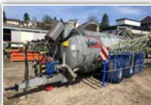
VAKUTEC Tandem Pumpfahrräder 8300 Liter , Bj. 2002, Neue Pumpe und neue Schlepplschläuche, Rota Cut Schneidwerk, 12 Meter Schlepplschlauchverteiler mit Schneidwerk, Druckluftanlage, 25.500.- inkl. Verm.