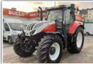
STEYR Profi CVT 4125 S8 , Neumaschine, 50 km/h - 24/24 - 8 fach Lastschaltgetriebe, Bereifung 540/65 R28 vorne und 650/65 R38 hinten, gef. VA, gef. Kab., Easy Tronic 2, S-Guide Vorrüstung, S-Tech 700 Monitor