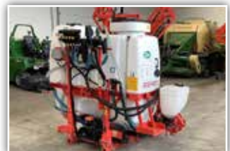
GASPARDO Teko 1000 X Feldspritze , Neumaschine, Bj. 2019, Inhalt 1000 Liter, 12 Meter Arbeitsbreite, 1x DW notwendig - Ölumlaufl, hydr. Klappbar-, höhenverstellbar-, Hangausgleich-, Reinwassertank, Innenreinigung, Beleuchtung, GW