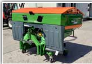
AMAZONE ZA-V 2000 Wiegestreuer , Neumaschine, Bj. 2022, ISOBUS, Limiter Grenzstreueinrichtung, Neigungssensor, Leermeldesensoren, Roll- und Abstellvorrichtung, Rollplane