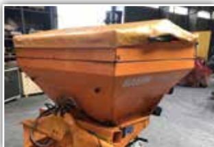
RAUCH Axexo 18.1 Winterdienststreuer , Bj. 2010, geschwindigkeitsabhängige Regelung mit Bordcomputer, elektr. Mengensteuerung, Aufsatz, Plane, Beleuchtung, Arbeitsbeleuchtung, 4.200,- inkl. 20% UST