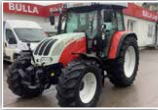
STEYR MT 9095 , Bj. 2009, 3350 h, Bereifung 480/65 R24 vorne und 540/65 R38 hinten, FH, DLA, Multicontroller, 4x DW (2x mechanisch mit Kreuzhebel und 2x elektrisch proportional), 58.800.- inkl. Verm.