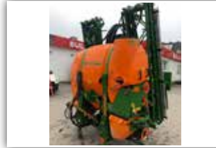
AMAZONE UF 1201 , Bj. 2012, 18 Meter Super S Gestänge, Amatron + Bordcomputer mit GPS Switch Teilbreitenschaltung, Distance Control Gestängeführung, Profi Klappung II, Load Sensing, 22.800,- inkl. Verm.