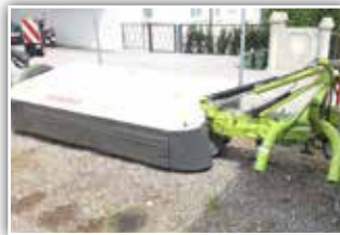
CLAAS Disco 2750 Heckmäherwerk , Neumaschine, Bj. 2022, Max Cut Mähbalken, Messerschnellwechsel, Schwadscheibe Innen und Außen, GW