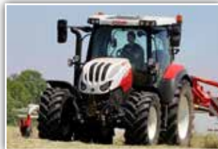
STEYR Expert CVT 4100 , Neumaschine, Bj. 2022, gef. VA, gef. Kab., 5x DW (3x mech. + 2x elektr.), FH und FZW, Bereifung 480/65 R24 vorne und 600/65 R34 hinten, Multicontroller 2, Hochdach, 12 LED Arbeitsscheinwerfer