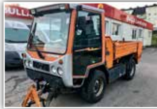
BOKI Mobil 1151 , Bj. 2003, 106 PS Motor, 100 km/h Fahrgeschwindigkeit, Schaltgetriebe, Multifunktionshebel, FH mit Dreieck, kippbare Ladefläche, Splitsteuer abnehmbar, 15.200.- inkl. 20% UST