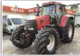
CASE IH CVX 150 , Bj. 2001, 7.800 h, gef. VA, gef. Kab., Bereifung 600/65 R28 vorne und 710/70 R38 hinten, FH + Leitungen nach vorne, Klima, 1 + 2 Leiter DLA, hydr. OL, 38.500.- inkl. Verm.