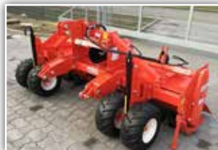
MASCHIO BIO SC Pro 280 Fräse , Neumaschine, Bj. 2022, hydraulische Heckklappe, 4x Stückräder vorne mit 22x11.00 - 10, Doppelmessersfahrschiff, GW mit Nockenschaltkupplung