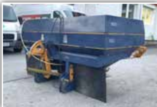
BOGBALLE EX Trend , Inhalt 1600 Liter, Grenzstreueinrichtung, Aufsatz, Rückwand von Aufsatz abnehmbar, Beleuchtung, Gelenkwelle, 3.200,- inkl. Verm.