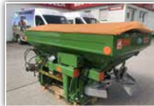
AMAZONE ZA-M 1500 Profis Wiegestreuer , 1500 Liter Inhalt, Abdeckplane, Limiter Grenzstreuschirm, OM 10 bis 16 Meter, Rahmen bis 3 Tonnen, Beleuchtung, Gelenkwelle, 7.700,- inkl. Verm.