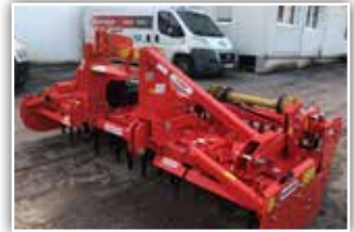
MASCHIO DC Classic 3000 Kreiselegge , Neumaschine, Bj. 2022, 3 Meter Arbeitsbreite, Zahnpackerwalze 500 mm, GW mit Nockenschaltkupplung