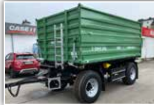
BRANTNER Z 15045 , Neumaschine 2022, 40 km/h Typisierung, 2x 80 cm Bordwände, Bordwandversteifung, autom. Anhängervorrichtung hinten, Durchleitungen hinten, Bereifung 385/65 R22.5 NEU