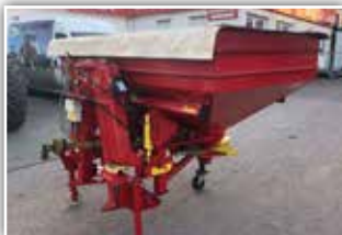
LELY Centerliner Wiegestreuer , Grenzstreueinrichtung, Bedienterminal, Aufsatz, Plane Beleuchtung, Gelenkwelle, 3.750,- inkl. Verm.