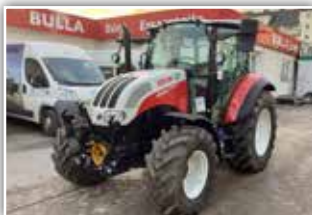
STEYR Kompakt 4100 , Stufe V, Bj. 2022, 100h, WM Pflüger Traktor, 24/24 Power Shuttle mit Lastschaltung, 40 Eco Getriebe, Bereifung 440/65 R20 vorne und 540/65 R30 hinten Michelin, FH und FZW, 5x DW mit Kreuzhebel, DLA, Klima