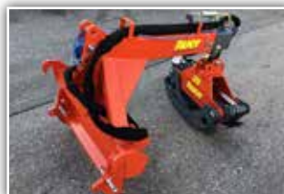
AUER 1700 EFT , Neumaschine, Bj. 2021, Öffnungsweite 170 cm, Lastarm 50 cm teleskopierbar, 100 Schildbreite mit Zacken, EURO Aufnahme und auf 3 Punkt anhängbar