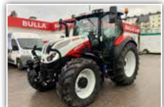
STEYR Expert CVT 4120 , Bj. 2021, 250 h, Vorführer, FL Konsole mit MSK, gef. VA, gef. Kab., Hochdach, Bereifung 480/65 R28 vorne und 600/65 R38 hinten, S-Guide RTK Lenksystem, S-Tech 700 mit Easy Tronic 2