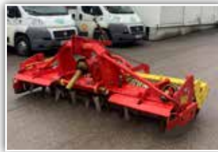
PÖTTINGER Lion 301 Kreiselegge , Zahnpackerwalze 500 mm, mechanisches Huckepack, klappbare Seitenschilder, Anbauachse Kat 2 und 3, Gelenkwelle, 6.600,- inkl. Verm.