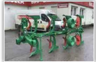
REGENT Titan 140 M Variabel , Neumaschine, Bj. 2021, Malblech W7, Scharspitz mit Meißel, Vorschäler, Scheibensech gezackt 560 mm, Doppelstützrad Blech 510 mm mit Hebelverstellung