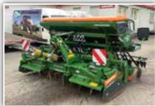
AMAZONE Säkombination KE 3001 Super/Catya 3000 Special RoTeC , Bj. 2020, Vorführer, 24 Schare, elektrischer Säantrieb mit Amadrill 2, Radar, Arbeitsstellungssensor, Zahnpackerwalze