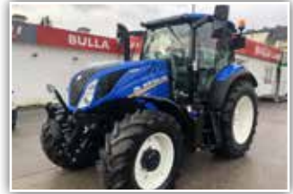
NEW HOLLAND T6.145 Auto Command , Bj. 2021, 100 h, 50 km/h - stufenloses Getriebe mit Parkbremse, Bereifung 480/65 R8 vorne und 600/65 R38 hinten, Side Winder II Armlehne, Intelli View Monitor, 97.700.- inkl. 20% UST