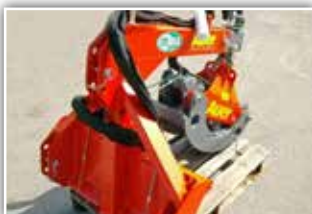
AUER 1700 ST mit Drehmotor , Neumaschine, Bj. 2021, Öffnungsweite 170 cm, Lastarm 50 cm teleskopierbar, 100 Schildbreite mit Zacken, 2x DW mit Drehmotor