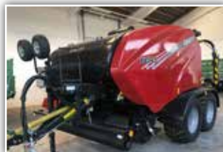
CASE IH RB 545 Silage Pack , Neumaschine, Bj. 2022, Durchmesser 125 cm, 20 Messer, Gruppenschaltung, Netz / Folienbindung, Tandemachse, Bereifung: 560/45 R 22.5, AFS 700 Monitor, Load Sensing, autom. Kettenöler & Zentralschmieranlage