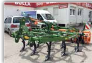
AMAZONE Cenius 3003 Mulchgrubber , Neumaschine, Bj. 2021, C-Mix Scharsystem, Doppelscheiben gezackt, Randfederelement, hydr. Tiefeneinstellung, Winkelwalze 580 mm