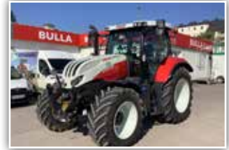
STEYR Profi CVT 4125 S8 , Vorführer, Bj. 2020, 400 h, 50 km/h, 24/24 - 8 fach Lastschaltgetriebe, S-Guide Vorrüstung mit Quick Turn 2, 540/65 R28 vorne und 650/65 R38 hinten, S-Tech 700 Monitor mit Easy Tronic 2