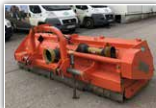
TIERRE TRL 280 Mulcher , Bj. 2015, Heckmaschine, Stützwalze, Y-Messer, Zapfwelle 540 U/min, Gelenkwelle, 3.900.- inkl. Verm.