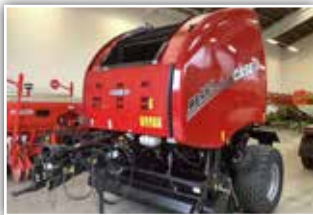
CASE IH RB 465 , Neumaschine, Bj. 2021, Durchmesser von 90 - 180 cm, + 235 cm PickUp, Bereifung 500/55 - 20, 15 Messer, 4 Endlosriemen, Weichkerneinrichtung, ISOBUS mit AFS 700 Monitor, DLA