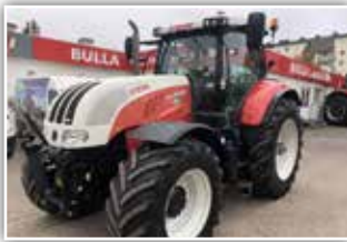
STEYR CVT 6230 , Bj. 2011, 6850 h, 50 km/h - stufenloses Getriebe mit Parkbremse, gef. VA, gef. Kab., 5x DW, Load Sensing, FH und FZW, 600/60 R30 vorne und 710/60 R42 hinten, Klimaautomatik, S-Tech 300 mit ISOBUS, 79.900.- inkl. Verm.