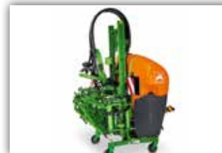
AMAZONE UF 901 , Neumaschine, Bj. 2022, Amaspray+ Bordcomputer, geschwindigkeitsabhängig, 12 Meter Q-Plus Gestänge, Düsenrohr