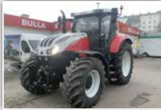
STEYR Absolut CVT 6185 , Bj. 2021, 500 h, Vorführmaschine, 650/65 R42 hinten, 600/65 R28 vorne Trelleborg, FH, pneu. Kabinenfederung, S-Brake, S-Tech 700 Monitor mit Lenksystemvorrüstung, S-Tronic Steuerung