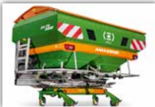
AMAZONE ZA-V 3200 Wiegestreuer , Neumaschine, Bj. 2022, ISOBUS, Limiter Grenzstreueinrichtung, Neigungssensor, Leermeldesensoren, Roll- und Abstellvorrichtung, Rollplane