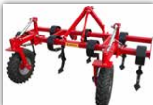
BRIX Goliath Frontgrubber , Neumaschine, Bj. 2022, 2 balkig, 7 Zinken mit Doppelherzschare, 2 Lenkräder 7.00 - 12, Beleuchtung