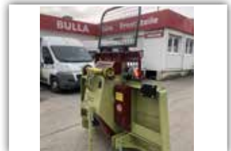
HOLZKNECHT HS 850 Seilwinde , Neumaschine, Bj. 2021, 8,5 Tonnen Zugkraft, 100 Meter - 11 mm gehämmert mit Parallelhaken, Autec Funk, Seilausstoß hydraulisch, Schildbreite 210 cm, Kipp Stop