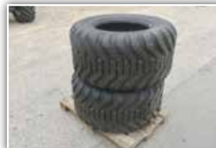
Reifen MITAS TR 08 , Dimension 500 / 60 - 22.5, Neu 100% Profil, 1.180,- inkl. Verm.