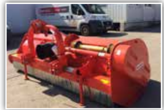
MASCHIO Tornado 280 Mulcher , Neumaschine, Bj. 2021, Heckgerät mit hohem Rotor, Freilauf integriert, Y-Messer, Walze, GW