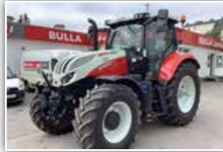
STEYR Profi CVT 6145 , Bj. 2020, 300 h, Mietmaschine, 50 km/h, S-Tech 700 Monitor mit ISOBUS, FH und FZW, Bereifung 520/60 R28 vorne und 650/60 R38 Michelin Xeobib, 5x DW mit Load Sensing