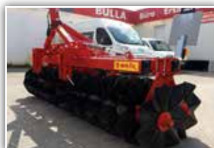
BRIX Twinn 300 Frontwalze , Neumaschine, Bj. 2021, 2 reihig mit Wellenscheiben, 560 mm Durchmesser, Beleuchtung