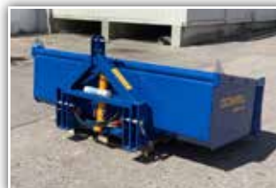
GÖWEIL Heckladen , Neumaschinen, Bj. 2021 und 2022, GHU 8/1850, GHU 10/2000, GHU 10/2200, GHU 12/2500 mit Bordwandschwenkvorrichtung und EURO Aufnahme