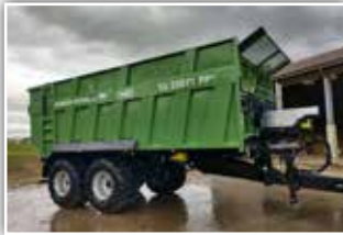
BRANTNER TA 23071 PP+ Abschiebewagen , Neumaschine, Bj. 2022, 40 km/h - 23 Tonnen Typisierung, 34m3, 32 To Fahrgestell, Lenkachse BPW, Federstabilisator Hinterachse, Bereifung 650/55 R26.5, Spur 2225 mm