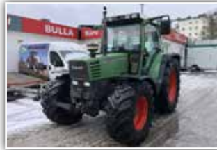
FENDT 509 C Turboshift , Bj. 1998, 10200 h, 50 km/h Getriebe, 44/44 Gänge, 6 Gänge, 4 fach Lastschaltung, Kriechgang, Turbokupplung, gef. VA, Bereifung 540/65 R24 vorne und 600/65 R38 hinten, FH, Klima, 38.600.- inkl. Verm.