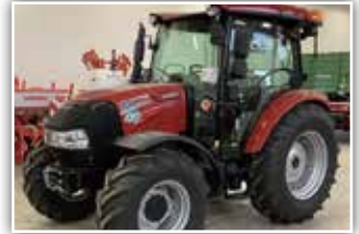
CASE IH Farmall 55 A , Bj. 2020, 30 h, Überbrückungsmaschine, 12/12 Synchro Shuttle Getriebe, 40 km/h, Bereifung 14.9 R20 vorne und 16.9 R30 hinten, 3x DW