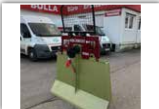
HOLZKNECHT HS 550 Seilwinde , Neumaschine, Bj. 2022, 5,5 Tonnen Zugkraft, 80 Meter - 10 mm gehämmert mit Parallelhaken, Autec Funk, Seilausstoß hydraulisch, Schildbreite 160 cm, Kipp Stop