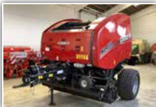
CASE IH RB 455 , Neumaschine, Bj. 2021, Durchmesser von 90 - 150 cm, + 235 cm PickUp, Bereifung 500/55 - 20, 15 Messer, 4 Endlosriemen, Weichkerneinrichtung, ISOBUS mit AFS 700 Monitor, DLA