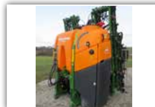
AMAZONE UF 1602 , Neumaschine, Bj. 2022, ISOBUS, Super S Gestänge 21/15 Meter, Profi Klappung 1, Rollvorrichtung, Saugschlauch, geschwindigkeitsabhängig, Distance Control Gestängeführung