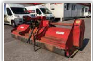
OMARV SHK 300 Mulcher , Bj. 2002, Front- und Heckgerät, Stützwalze, Gleitkufen, Y-Messer, 2.900.- inkl. Verm.