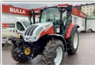
STEYR Kompakt 4090 , Neumaschine, Stufe V - neue Motorgeneration, Bj. 2022, 40 km/h ECO Getriebe, Power Shuttle, Lastschaltung, Bereifung 340/85 R24 und 420/85 R34, Klima, DLA