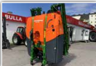
AMAZONE 1302 , Neumaschine, Bj. 2021, Amaspray+ Bordcomputer, Super S Gestänge 15/12 Meter, LED Einzeldüsenbeleuchtung, 7 Teilbreiten, Neigungsverstellung, Rollvorrichtung, Saugschlauch