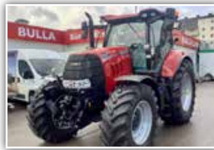
CASE IH Puma 165 Multicontroller , Neumaschine, Bj. 2022, 19/6 Full Powershift Getriebe, 50 km/h, Bereifung 540/65 R30 vorne und 650/65 R42 hinten, Deluxe Kabine, Lenksystemvorrüstung mit Quick Turn 2