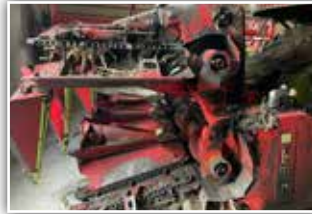
OLIMAC Drago 2 Maispflücker , 6 reihig, Bj. 2012, hydr. klappbar, automatische Pflückplattenverstellung, Unterbauhückerler, Adapter passend zu Claas Lexion bzw. Tucano, 24.800,- inkl. Verm.