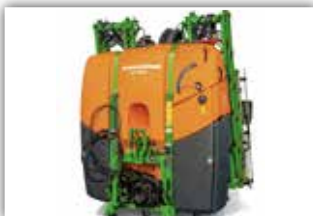
AMAZONE 1302 , Neumaschine, Bj. 2022, ISOBUS, Super S Gestänge 15/12 Meter, Vorwahlklappung, Rollvorrichtung, Saugschlauch