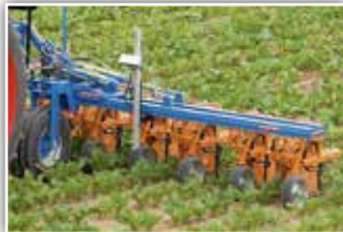
SCHMOTZER Hackgerät Kombi Fronthacke Rübe , Neumaschine, Bj. 2022, 6 x 45 cm, Vorbauträger, Hackschutzrollen, Fingerhacke mit Sternparallelogramm, Beleuchtung