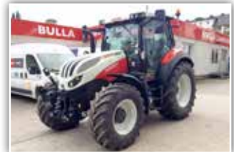
STEYR Expert CVT 4100 , Bj. 2021, 150 h, Mietmaschine, gef. VA, gef. Kab., FH, 4x mech. DW, Hochdachkabine, 12 LED Arbeitsscheinwerfer, Bereifung 480/65 R24 vorne und 600/65 R34 hinten, Grammer Dual Motion