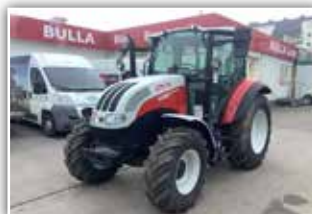
STEYR Kompakt 4080 , Neumaschine, Stufe V, 12/12 Synchro Shuttle, 4x DW mit Kreuzhebel, 2x Zusatzhubzylinder, Bereifung 380/85 R20 vorne und 420/85 R30 hinten, Luftsitz, Klima, MHR