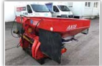
RAUCH Axis 30.1. Düngerstreuer , Bj. 2008, hydr. Schieberbetätigung, Telimat Grenzstreuschirm, 3000 kg Nutzlast, Beleuchtung, Gelenkwelle, 4.450,- inkl. Verm.