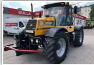
JCB 155 Turbo , Bj. 1999, 10950 h, 65 km/h Fahrgeschwindigkeit, Lastschaltgetriebe, FH und FZW, DLA, Bereifung 540/65 R30, 3x DW, 29.500.- inkl. Verm.