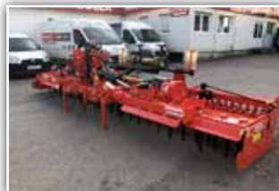
MASCHIO Aquila 6000 Classic Kreiselegge , Neumaschine, Bj. 2021, 6 Meter Arbeitsbreite, hydraulisch klappbar, Zahnpackerwalze 500 mm, GW mit Nockenschaltkupplung