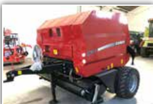
CASE IH RB 344 , Neumaschine, Bj. 2021, Fixkammer 125 cm, Bereifung 19.0/45-17, 200 cm PickUp, 15 Messer mit Gruppenschaltung, Bedienmonitor, Dichteeinstellung über Monitor, WWGW, autom. Kettenschmierung