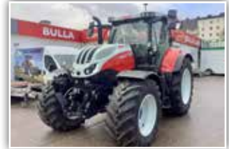
STEYR Impuls CVT 6165 Vorführer, Bj. 2021, 350 h, Vorführer, Bereifung 650/65 R42 hinten und 600/65 R28 vorne, S-Guide Lenksystem mit RTK, Deluxe Kabine mit Grammer Dual Motion, S-Brake, FH und FZW