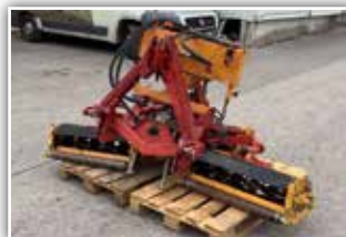
RASANT Spindelmäher , 3 Spindeleinheiten mit 6 Klingen, Tiefenführungsrolle, 3 Punkt Anbau, hydr. Ölmotorantrieb, Eigenölversorgung, 2.450,- inkl. Verm.