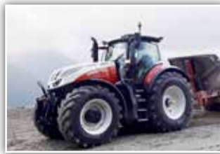
STEYR Terrus CVT 6300 Vorführer, neues Modell, Bj. 2022, verfügbar ab Sommer/Herbst, Infomat 1200 Monitor, Bereifung 710/70 R42, S-Brake, S-Guide Lenksystem, 7x DW, Klimaautomatik, S-Tronic Steuerung