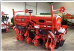
GASPARDO Chrono Maissämaschine , Neumaschine, Bj. 2021, 6 reihig, Reihenabstand 75 cm, HIGH SPEED Sätechnik, Düngertank, elektrischer Säantrieb, hydraulisch angetr. Kompressor, Räumsterne, Schneidscheiben, ISOBUS