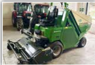
AMAZONE Profi Hopper PH 1500 , Neumaschine, Bj. 2022, Selbstfahrer, 45 PS Dieselmotor, 150 cm Schnittbreite, HS 77 Mähflügel mit Vertikutiermesser, Grammer „Comfort“ Sitz, Hochentleerung 250 cm