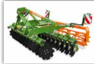
AMAZONE Catros 3003 Kurzscheibenegge , Neumaschine, Bj. 2020, glatte Scheiben für exakte Bearbeitung, hydraulische Tiefenverstellung, Stabwalze 520