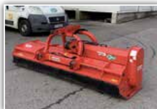
MASCHIO Bisonte 280 Mulcher , Bj. 2018, Front- und Heckgerät, Getriebe 1000 U/min, Stützwalze, Gleitkufen, Freilauf im Getriebe, hydr. Seitenvershub, Hämmer, Gelenkwelle, 4.900.- inkl. Verm.