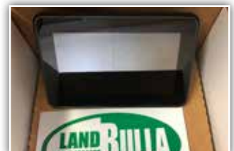
TRIMBLE Parallelfahrhilfen , Neugeräte, Bj. 2021, EZ Guide 250 bzw. XCN 750, neues Modell, Antenne mit Kabel, Stromanschluss