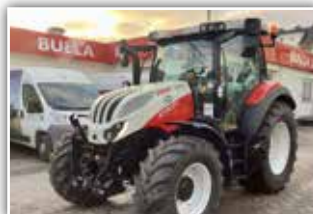
STEYR Expert CVT 4110 , Neumaschine, Bj. 2022, gef. VA, gef. Kab., Bereifung 480/65 R24 vorne und 600/65 R34 hinten, FH und FZW, Hochdach, 12 LED Arbeitsscheinwerfer, Grammer Dual Motion