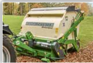
AMAZONE Gras Hopper GH 2100 Super , Neumaschine, Bj. 2021, 3-Punkt Anhängung, HS 77 Mähflügel mit Vertikutiermesser, Beleuchtung