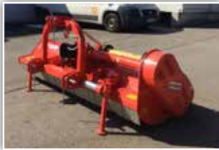
MASCHIO Brava 250 Mulcher , Neumaschine, Bj. 2021, AKTIONSMODELL, bis 80 PS Heckgerät, Freilauf integriert, Hämmer Walze, GW