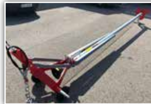
VAKUTEC TMSH 5 Meter GÜllemixer , Neumaschine, Bj. 2021, hydr. Neigungsverstellung, Stützfuß, HE 19 Rührflügel