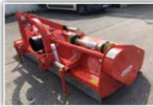
MASCHIO Tigre 280 Mulcher , Neumaschine, Bj. 2022, Heckgerät, hydr. Seitenvershub optional, Freilauf integriert, Walze, Hämmer, GW