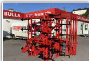
BRIX Unimax 500 Leichtgrubber , Neumaschine, Bj. 2021, 32 Gänsefußschare mit 70x12 mm, Zustrichter, Stabwalze