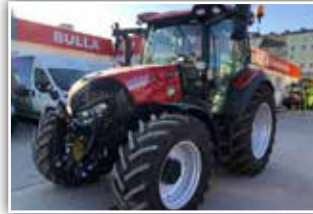
CASE IH Vestrum CVX 100 , Bj. 2022, 250 h, Vorführer, gef. VA, gef. Kab., 440/65 R28 vorne und 540/65 R38 hinten, LED Arbeitsscheinwerferhalle, 5x DW