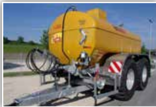
VAKUTEC MKE 14 PU Light ECO Pumpfass , Neumaschine in Bestellung für Ende 2022, 40 km/h Typisierung, DLA mit ALB, Untenanhängung mit K80, Pendel Trapez Lenkachse, Schleppschuhvorbereitung