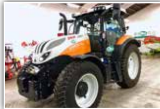
STEYR Profi CVT 4125 Kommunal , Bj. 2019, 600 h, Vorführer, 50 km/h Getriebe, Kommunalrahmen, Kommunalbereifung 400/80 R28 vorne und 480/80 R38 hinten Nokian, Kommunalbalken