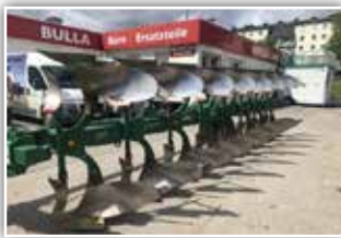
REGENT TAURUS 200 SCX Aufsattel Drehpflug , 8 Schar Pflug, Bj. 2002, hydr. Schnittbreitenverstellung, Vorschüler, Scheibensech gezackt, Unterlenkerachse Kat III, 17.600,- inkl. 20% UST