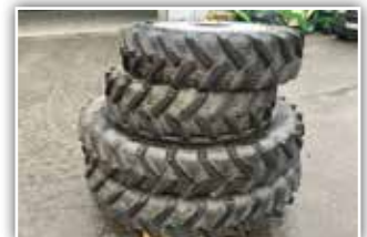
Pflegeräder von CASE JXU , Dimension 270/95 R44, 280/85 R28 BKT, Reifen sind neu, Fixfelgen, Spur 150 cm, 3.950,- inkl. Verm.