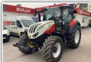
STEYR Expert CVT 4120 , Neumaschine, gef. VA, gef. Kab., Multicontrollerarmlehne 2, FH und FZW, Bereifung 480/65 R24 vorne und 600/65 R34, Grammer Dual Motion, 6x DW, Panoramadach, erweiterter Kreuzhebel