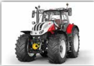
STEYR Terrus CVT 6300 Neumaschine, neues Modell, Bj. 2022, Infomat 1200 Monitor, S-Brake mit auto. Lenkachssperre, S-Tronic Steuerung, 710/70 R42 Michelin, 7x DW, S-Guide Lenksystemvorrüstung