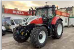
STEYR Impuls CVT 6165 , Bj. 2022, Neumaschine, Bereifung 650/65 R42 hinten und 540/65 R30 vorne, 5x DW, FH, FZW, S-Guide Lenksystemvorrüstung, S-Tronic Steuerung, S-Brake, 16x LED AS und 2x Drehlicht