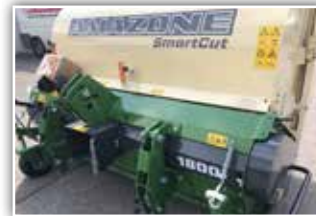
AMAZONE Gras Hopper GHS 1500 Drive , gebraucht, Bj. 2015, gezogene Variante, HS 77 Mähflügel mit Vertikutiermesser, elektrohydraulische Steuerung