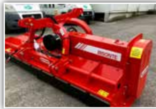
MASCHIO Bisonte 280 Mulcher , Neumaschine, Bj. 2021, neues Modell, Front- und Heckgerät, hydr. Seitenvershub, Freilauf integriert, Walze, Hämmer, GW