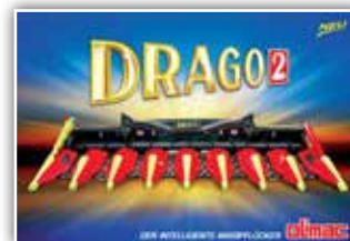
OLIMAC Drago 2 , Neumaschinen von 4 bis 18 Reihen, automatische Pflückplattenverstellung, 70 bis 75 cm Reihenweite, gehärtete Pflückschienen, Unterbauhäcksler horizontal einfach, Ersatzteilstützpunkt in Sierning