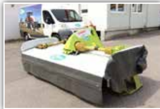
CLAAS Disco 3150 F Profil Frontmäherwerk , Bj. 2020, Vorführer, Max Cut Mähbalken, Messerschnellwechsel, Klappbare Seitentücher, Schwadscheibe, Fördertrommel links, Entlastungsfedern, GW