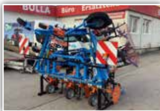
SCHMOTZER Hackgerät Kombi Fronthacke Mais , Bj. 2022, Vorfühmaschine, 6 x 70 cm, Vorbauträger, Hackschutzrollen, Fingerhacke mit Sternparallelogramm, Beleuchtung