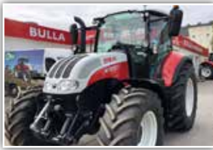
STEYR Multi 4120 , Neumaschine, Bereifung 480/65 R24 vorne und 600/65 R34 hinten, LED Arbeitsscheinwerfer, Drehlicht, DLA, Klima, FH, gef. VA, gef. Kab., S-Stop, Premium Luftsitz, 4x DW, 100 l/min Pumpe