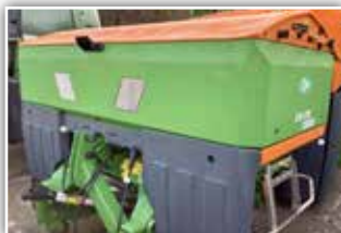
AMAZONE ZA-TS 2600 Wiegestreuer , Neumaschine, Bj. 2022, ISOBUS, Auto TS Grenzsteuerung mit Flow Control, Neigungssensor, Leermeldesensoren, Roll- und Abstellvorrichtung, Rollplane