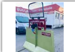
HOLZKNECHT HS 750 Seilwinde , Neumaschine, Bj. 2022, 7,5 Tonnen Zugkraft, 100 Meter - 11 mm gehämmert mit Parallelhaken, Autec Funk, Seilausstoß hydraulisch, Schildbreite 190 cm, Kipp Stop