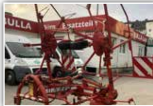
SIP Spider 555 Pro, Kreiselmäher , Bj. 2005, hydraulische Klappung, Gelenkwelle