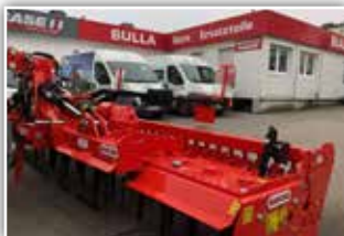
MASCHIO Falca 5000 HD Kreiselegge , Neumaschine, Bj. 2021, 5 Meter Arbeitsbreite, hydraulisch klappbar, Zahnpackerwalze 500 mm, GW mit Nockenschaltkupplung