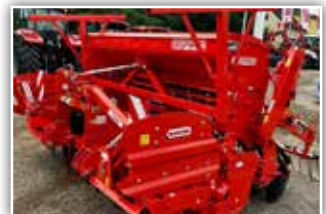
MASCHIO Säkombination DC Classic 2500 / Dama 2500 New Edition , Neumaschine, Bj. 2022, 2,5 Meter, Zahnpackerwalze, Doppelscheibenschar Corex Plus mit Samenandruckrollen, Striegel, GW mit Rutschkupplung