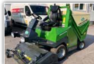
AMAZONE Profi Hopper PH 1250 , Bj. 2021, 50 h, Vorführer, Selbstfahrer, 25 PS Dieselmotor, 125 cm Schnittbreite, HS 77 Mähflügel mit Vertikutiermesser, Drehlink, Sitzheizung, Rasenbereifung, 210 cm Hochentleerung