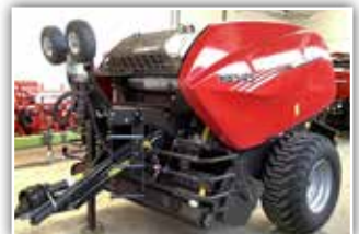
CASE IH RB 545 , Neumaschine, Bj. 2022, ISOBUS, Durchmesser 125 cm, 20 Messer, Gruppenschaltung, Netz / Folienbindung, Bereifung: 500/60 - 22.5, AFS 700 Monitor, autom. Kettenöler, autom. Zentralschmieranlage