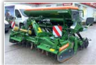
AMAZONE Säkombination KE 3001 Super/Catya 3000 Special Twin Tec , Bj. 2022, Vorführer, ISOBUS, 20 Doppelscheibenschare, elektrische Säantrieb, hydr. Trapezwalze, Quicklink mit Abstellstützen