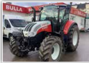
STEYR Multi 4120 , Bj. 2019, 650 h, 32/32 Gang gef. VA, gef. Kab., Bereifung 480/65 R24 vorne und 600/65 R34 hinten, FH, 5x DW, DLA, Klima, LED Arbeitsscheinwerfer, Drehlicht, 78.500.- inkl. Verm.