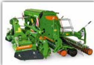
AMAZONE Säkombination AKTIONSMODELL, KE 3001 Special/AD 3000 Super , Neumaschine, Bj. 2021, 24 RoTeC Schare, Zahnpackerwalze, Amalg+ Fahrgassenschaltung, Exaktstriegel