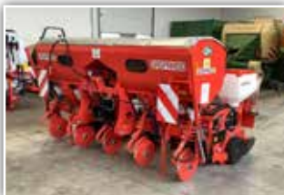
GASPARDO MTR , Neumaschine, Bj. 2021, 5 reihig, 1200 Liter Düngertank mit Doppelscheibenschar, MTR Säaggregat bis 150 kg, Samen- und V-Andruckrollen, hydr. Spuranzeiger, ISOBUS mit Säüberwachung